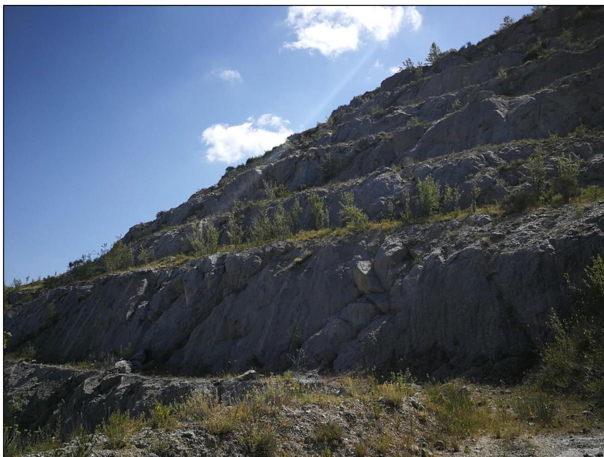
Foto 6: Vista dal gradone 340m. Dal gradone a quota 350m al gradone 400m il ripristino è stato completato e ne viene seguito lo sviluppo dopo l'attecchimento.