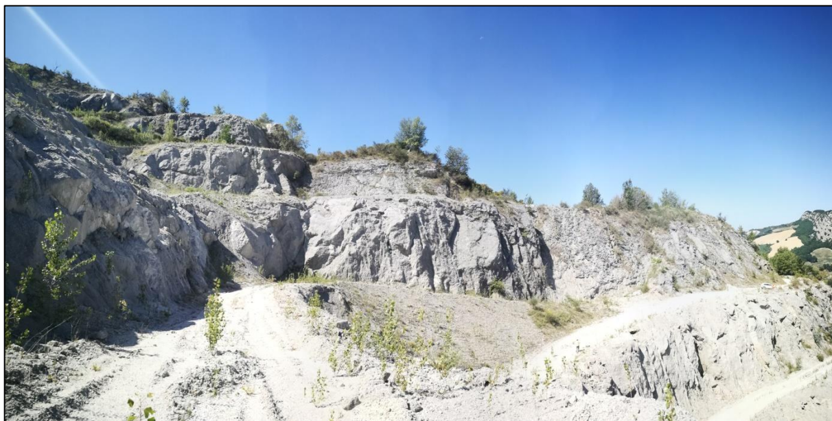
Foto 7: Zona verso Casola Valsenio, sono presenti le rampe di arroccamento che non saranno rimosse ma rimarranno percorribili allo scopo di permettere eventuali utilizzi futuri dell'area.