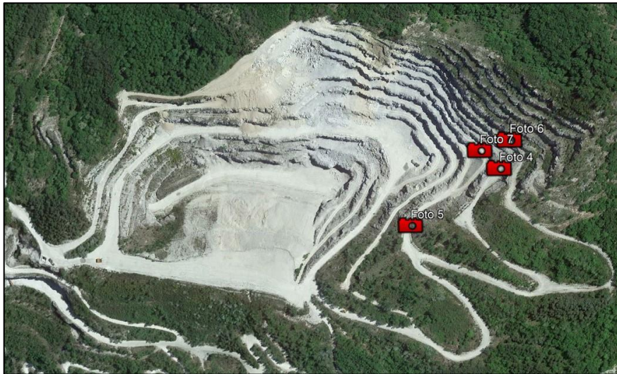
Figura 2: Punti di ripresa fotografica interni