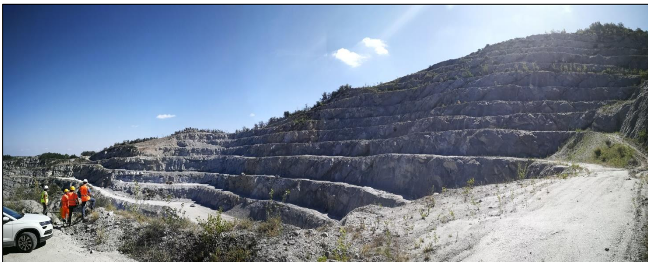
Foto 5: Progressione della gradonatura in linea col progetto approvato