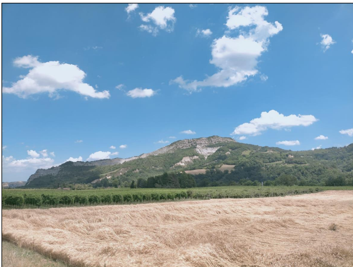
Foto 3: Lato Casola Valsenio SP306. Da questo versante è osservabile che il ripristino dei gradoni sommitali inizia a “confondere” l’area di cava con il pendio roccioso contiguo