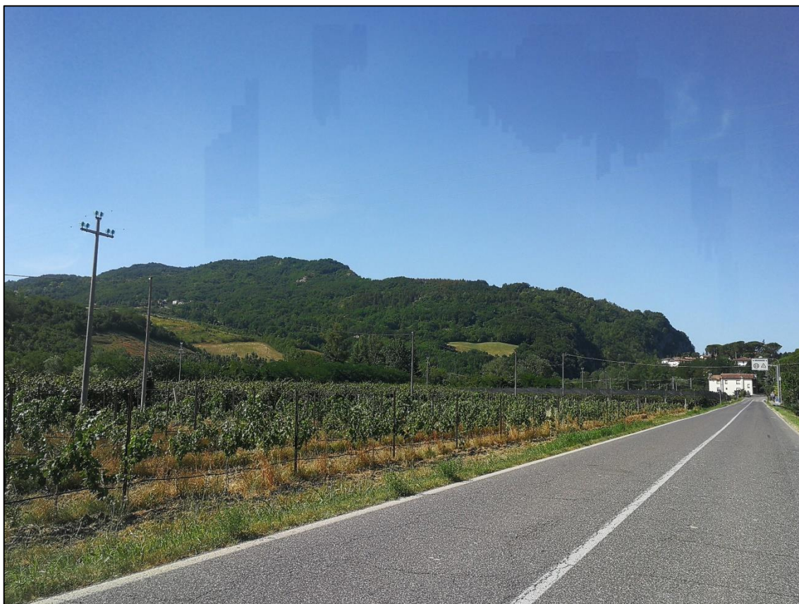
Foto 2: Versante Riolo Terme, SP306. Come prescritto nelle precedenti autorizzazioni lo skyline è intatto e la cava non è visibile