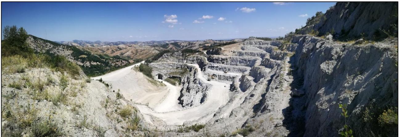
Foto 4: Vista generale da gradone 320 m. Sono visibili i gradoni sottostanti da coltivare e quelli soprastanti già in fase di ripristino che continuerà negli anni. Il mezzo d'opera transita sul gradone 265 m che verrà lasciato di ampiezza circa 16 m.