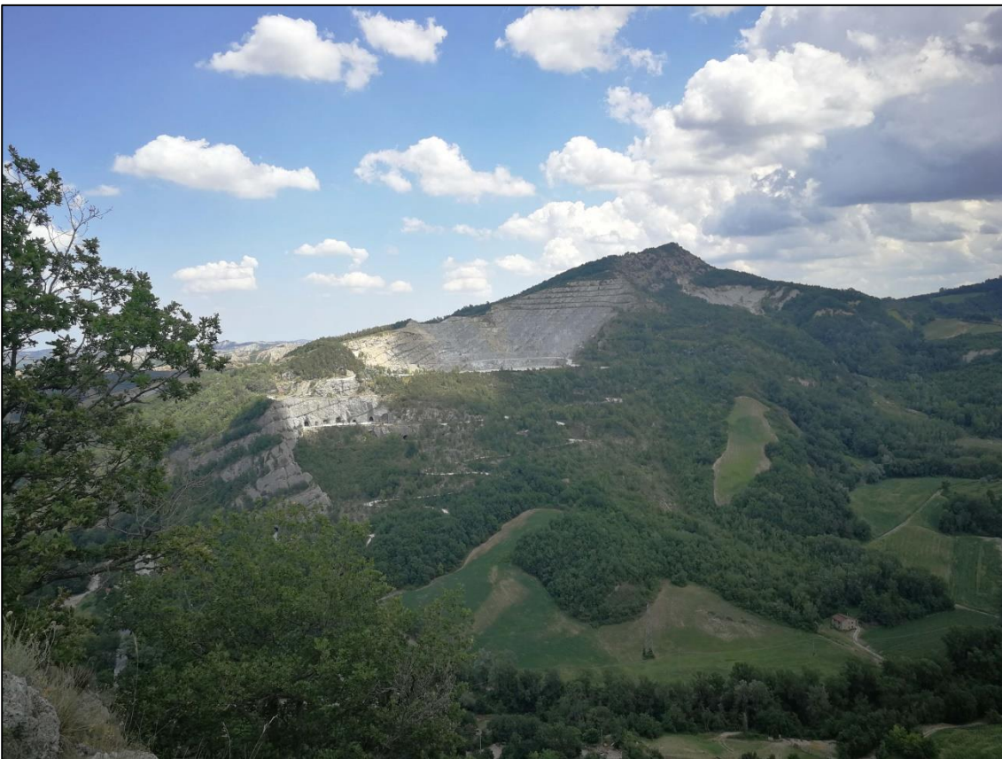
Foto 1: Dal versante opposto, Chiesa di San Benedetto di Sasso Letroso