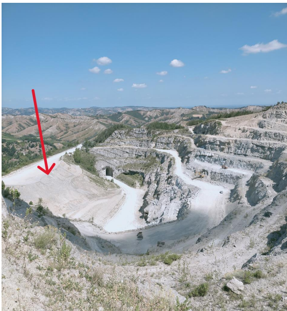
Foto 1 – panoramica dell'area di cava con il cumulo dal lato interno (freccia rossa)

Come anticipato in premessa, il cumulo già in uso nel corso delle precedenti autorizzazioni di cava non sarà più alimentato, in quanto l'evoluzione dello stabilimento di Casola rende possibile l'utilizzo del giacimento al 100%.