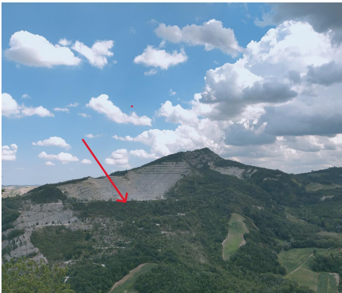
Foto 2 – panoramica dell'area di cava con il cumulo/quinta protettiva rinverdito visto dall'esterno

Il pendio verso l'esterno mantiene le stesse caratteristiche morfologiche (inclinazione, altezza e pista intermedia), ed il paramento esterno è stato già rinverdito e rinaturalizzato (Foto 2), mentre su quello interno verrà realizzata una pista intermedia a quota 250 m per permettere un coronamento completo con il corrispettivo gradone di coltivazione ed una a quota 240 m con la doppia funzione di interrompere un pendio altrimenti troppo lungo e permettere l'esecuzione di un successivo ripristino ambientale con relativa manutenzione.