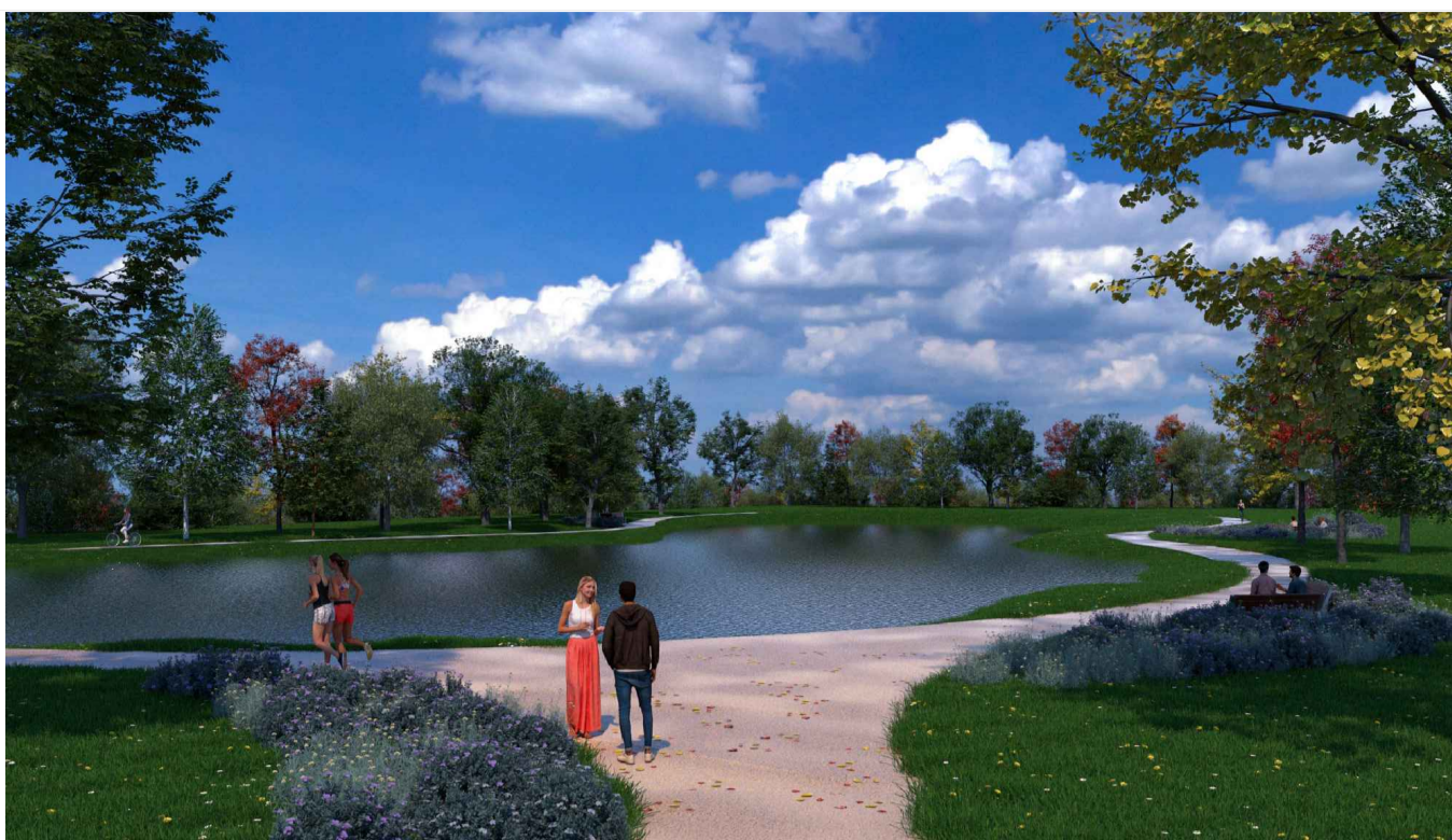
V2 - con vasca inondata