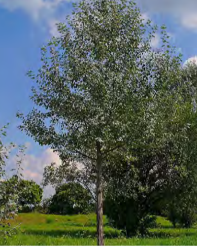
Populus alba "Bolleana"