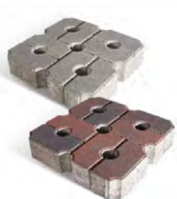
Esempio di pavimentazione in massetti drenanti