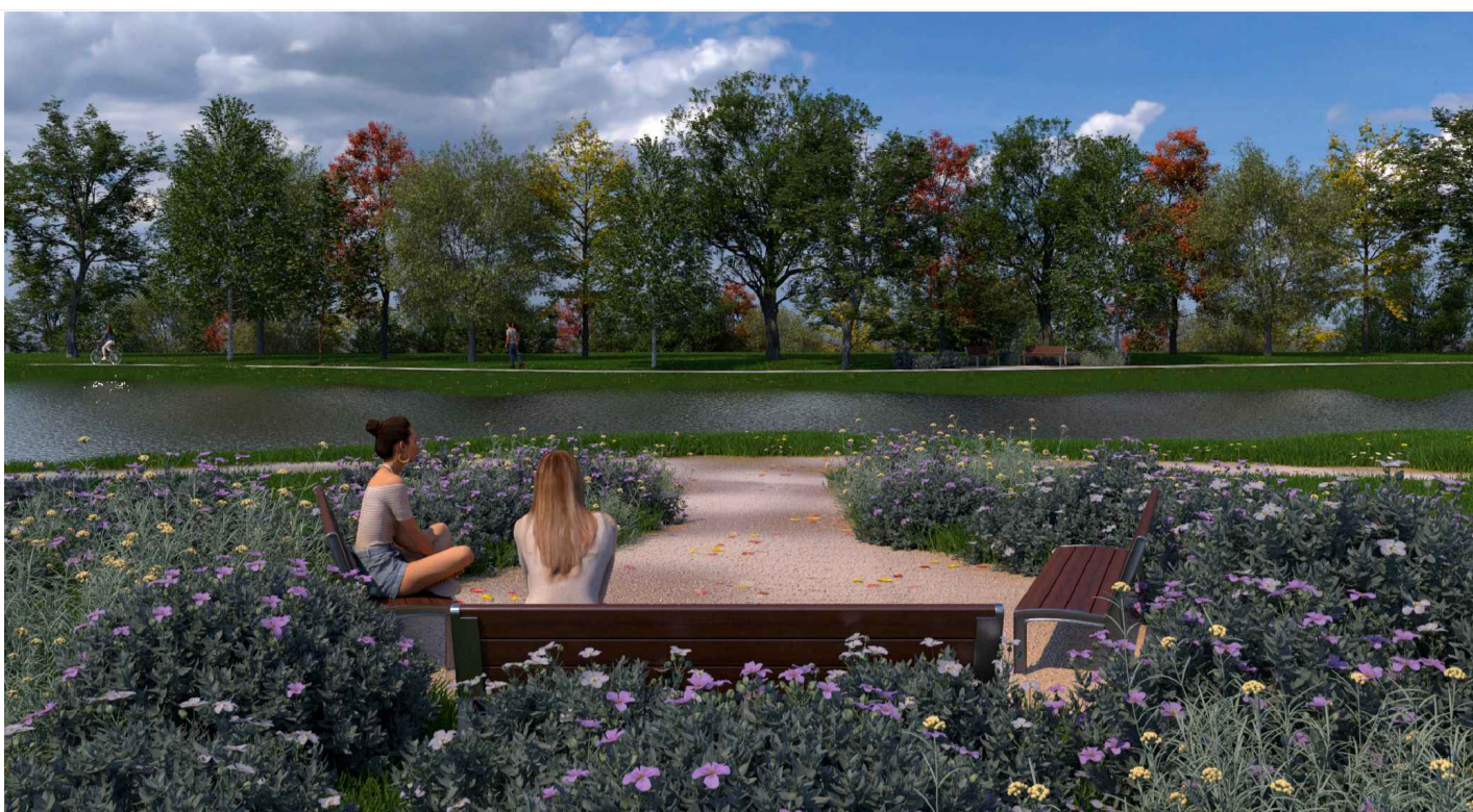
V1 - con vasca inondata