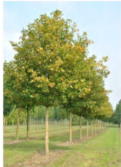
Acer Campestre "Elsrijk"