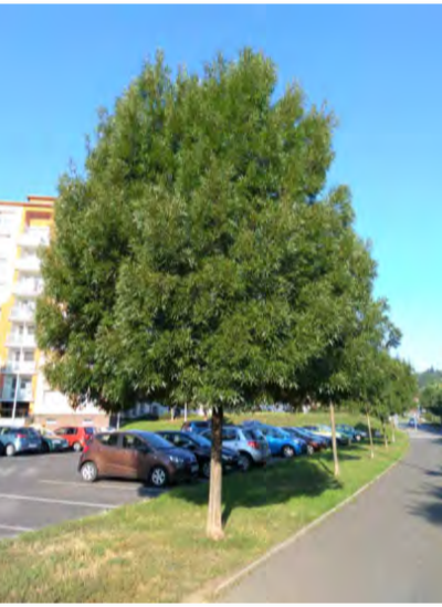
Fraxinus Angustifolia "Raywood"