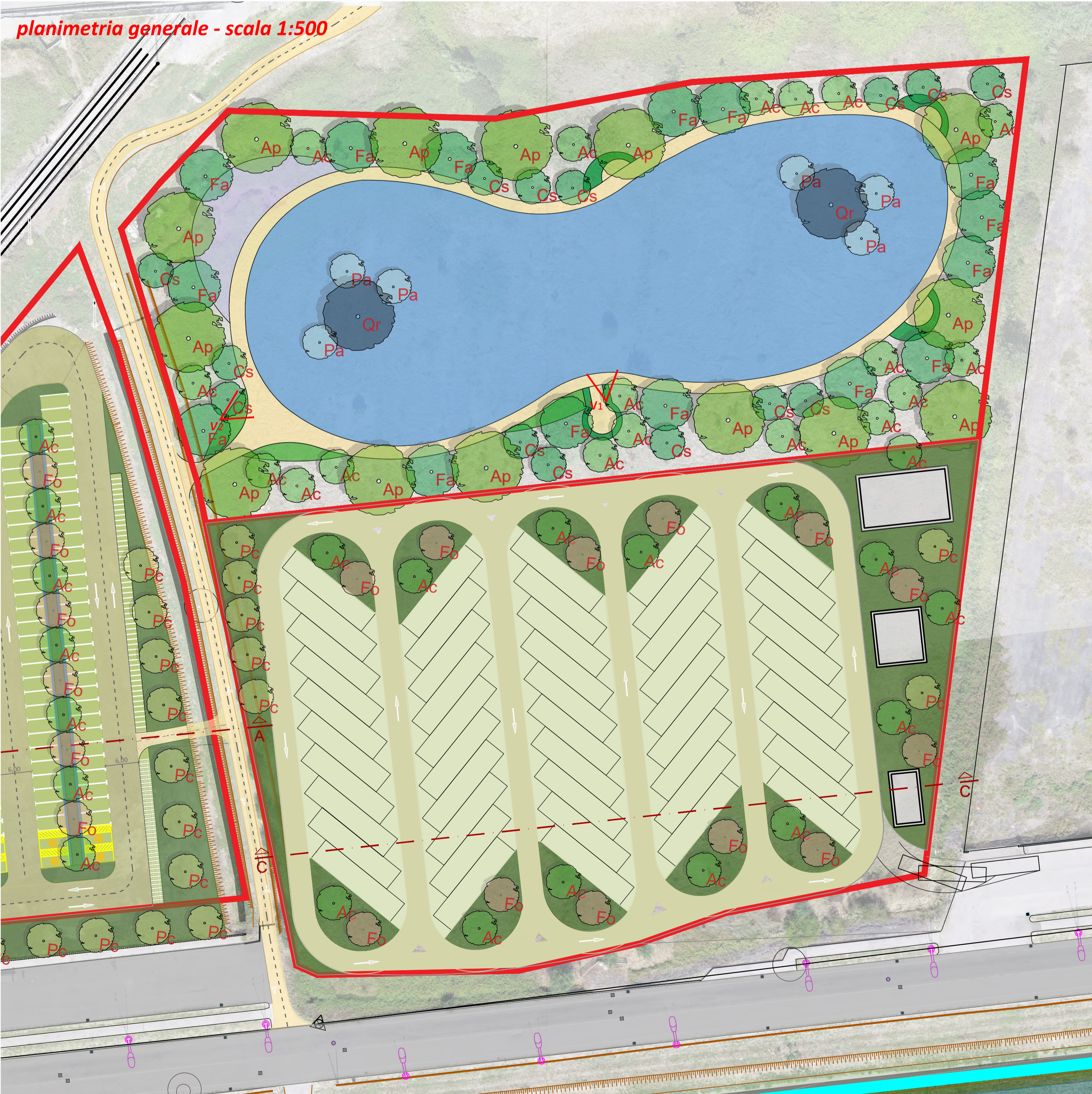
planimetria generale - scala 1:500