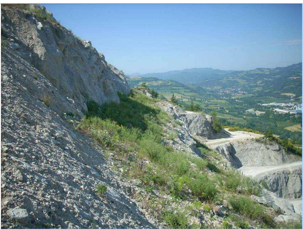
Figura 5 - particolare della vegetazione in crevotto ottobre 2011