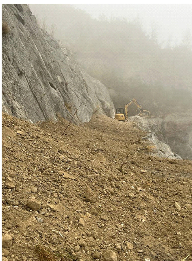
Figura 3 - particolare accumulo materiale terreno il materiale terreno trasportato sui gradoni con palo chiodato e frangiflutti con miltescavatore