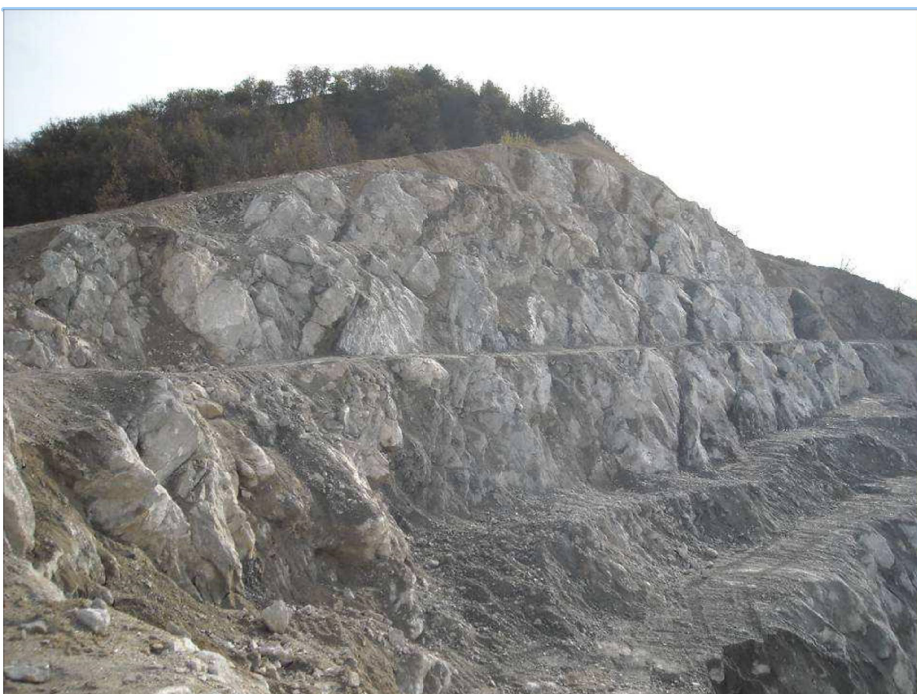
Figura 1 - fase di realizzazione del gradoni quota 350 - 400 novembre 2008