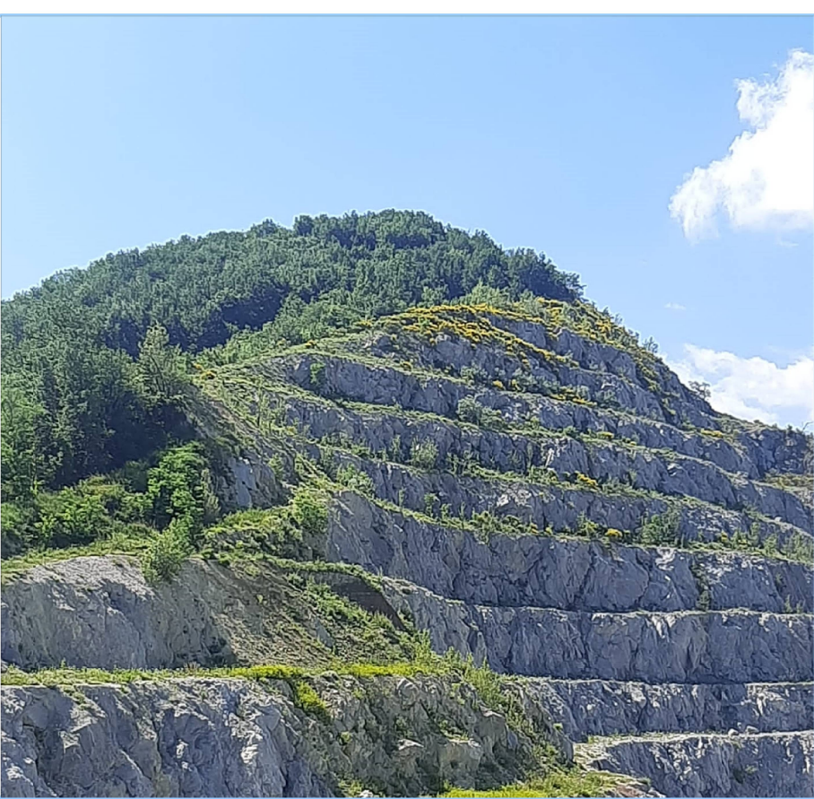
Figura 8 - veduta panoramica dei gradoni in fase di finalizzazione ottobre 2023