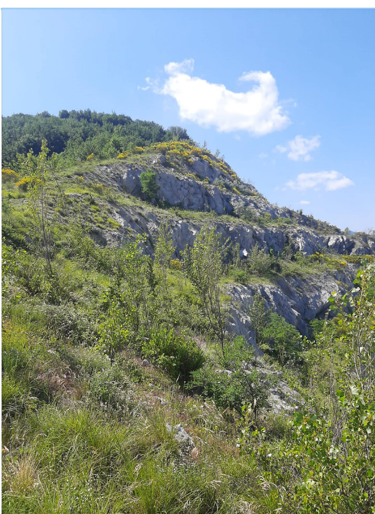
Figura 7 - veduta dei gradoni in fase di finalizzazione ottobre 2023