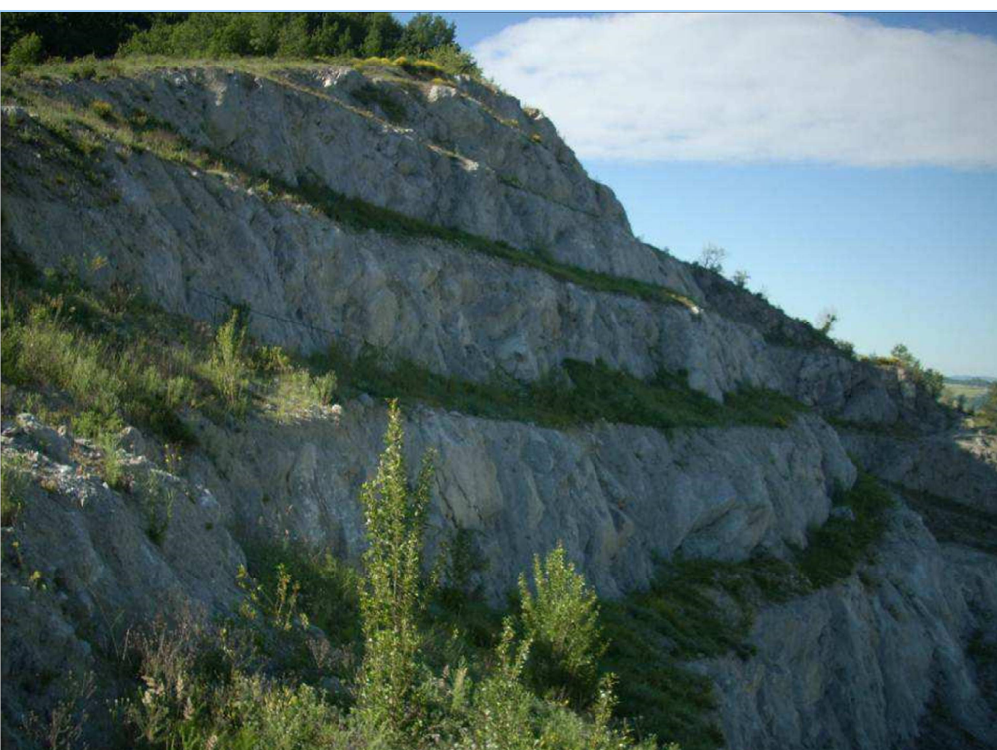
Figura 6 - veduta dei gradoni in fase di finalizzazione ottobre 2014