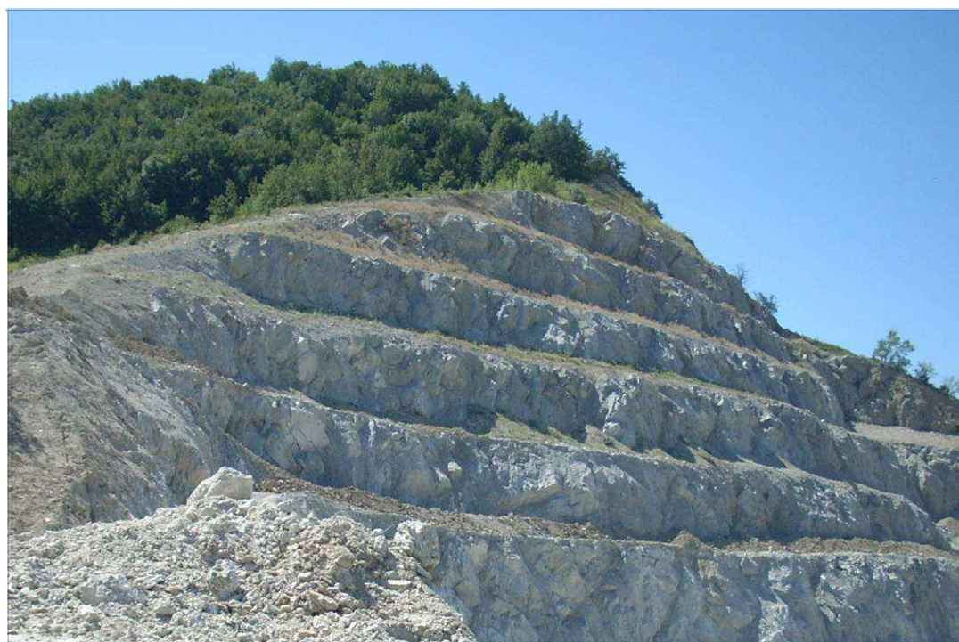
Figura 4 - stato di avanzamento del fase di riporto del materiale sulle quota 350 - 400 ottobre 2010