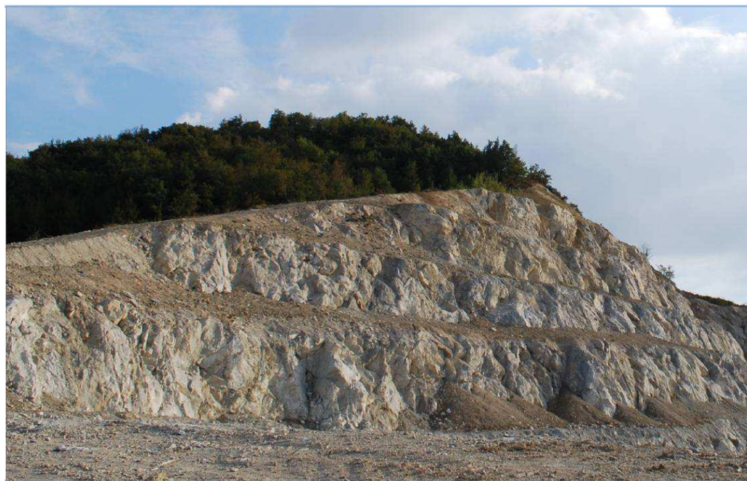
Figura 2 - fase di riporto e accumulo del materiale lungo i gradoni quota 350 - 400 ottobre 2009