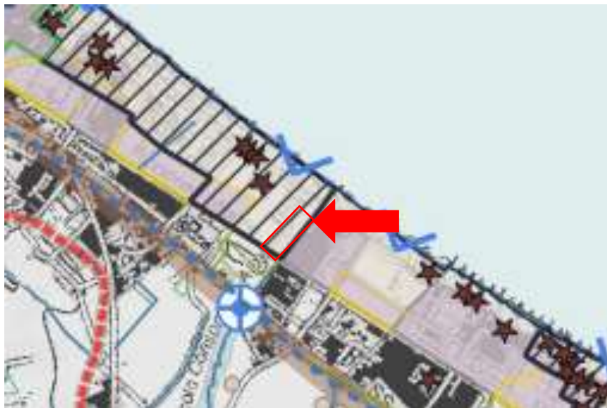
ESTRATTO: 03_T5_TAVOLA_TUTELA_DEL PATRIMONIO_PAESAGGISTICO

CON LA PRESENTE OSSERVAZIONE SI CHIEDE DI CONSIDERARE L'AREA INDIVIDUATA NEGLI ESTRATTI CARTOGRAFICI ALLEGATI COME AREA DA POTER ADIBIRE, ATTREZZARE E UTILIZZARE COME PARCHEGGIO E SERVIZI PER LE ATTIVITA' RICETTIVE ESISTENTI, COMPROPRIETARIE DELL'AREA.