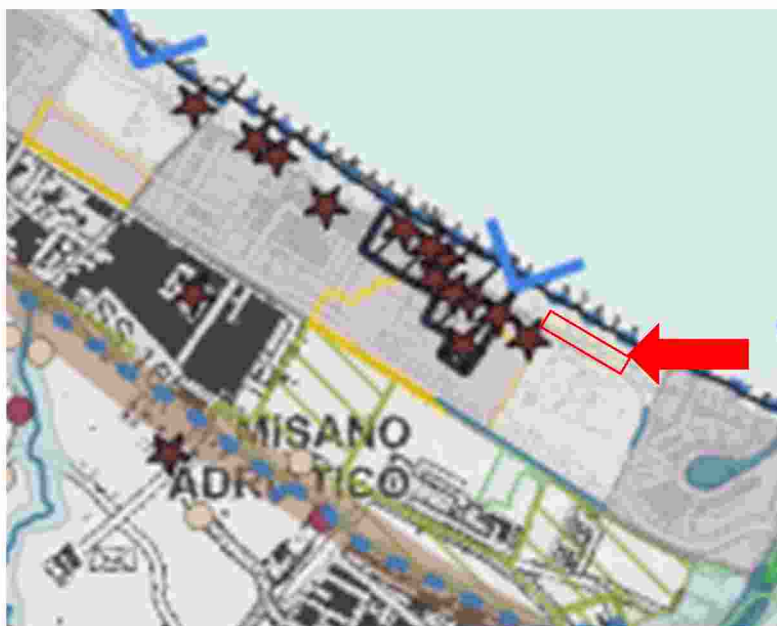
ESTRATTO: 03_T5_TAVOLA_TUTELA_DEL PATRIMONIO_PAESAGGISTICO