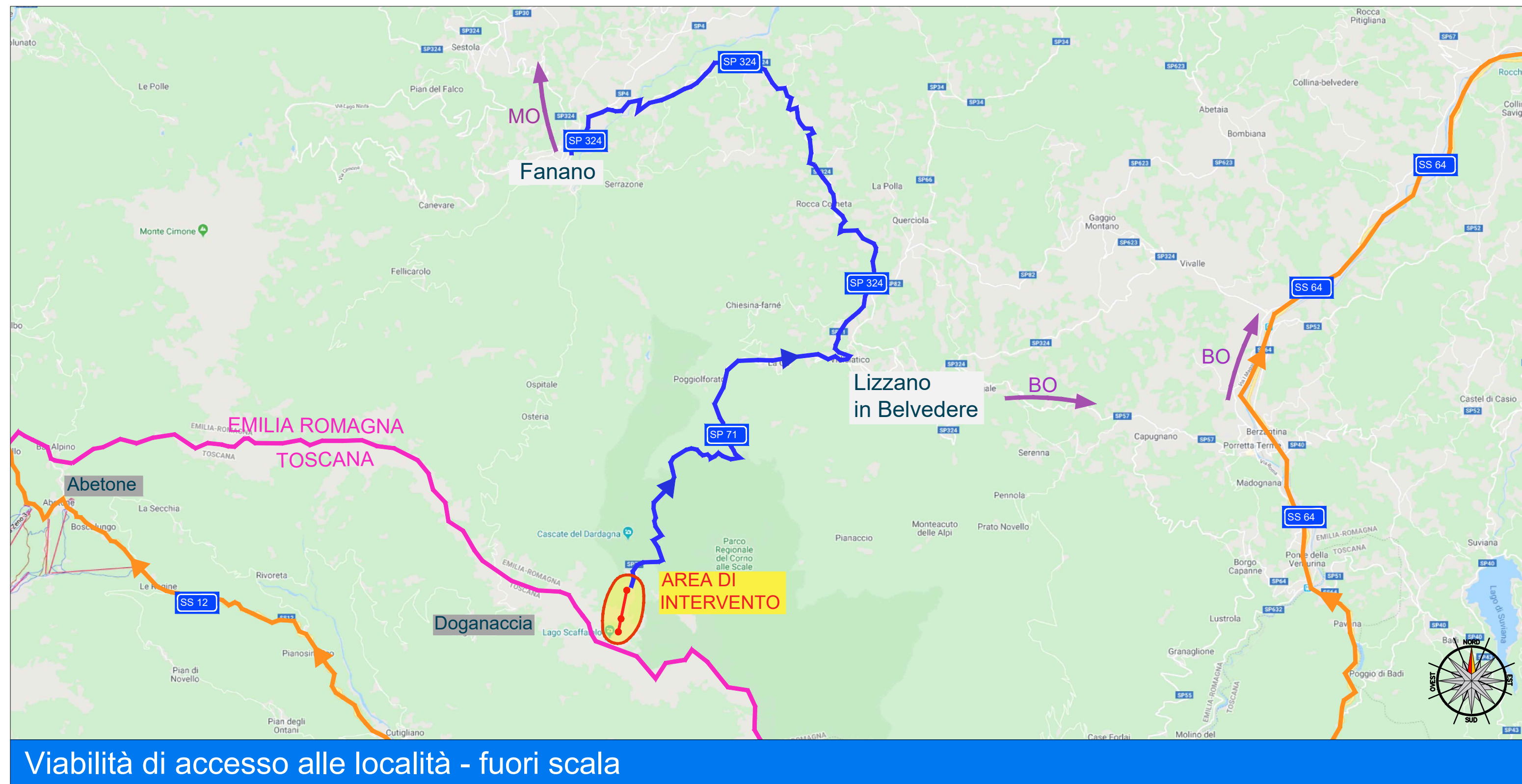
Viabilità di accesso alle località - fuori scala