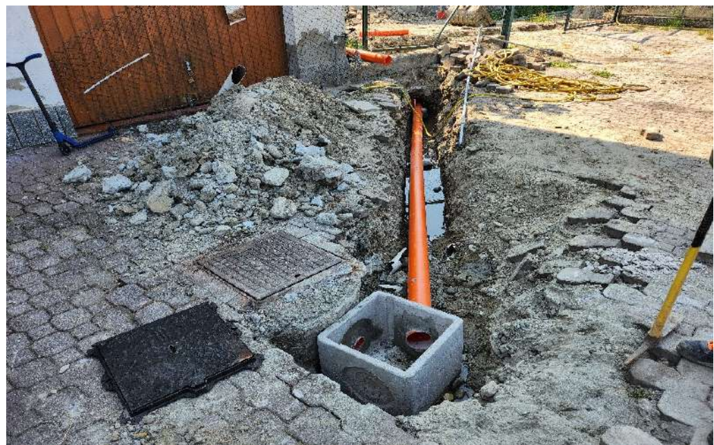
Foto della condotta di sub irrigazione posata dopo il pozzetto o di cacciata.