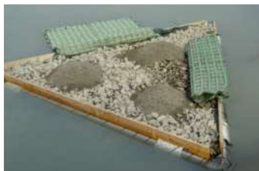
Figura 106. Esempio tipologico di isolotto galleggiante (singola unità)

La soluzione prevista risulta indicata anche per compensare quelle problematiche dell'avifauna derivanti dalle fluttuazioni idriche nell'ambito del presente progetto. La tipologia e il numero previsto di isolotti galleggianti (in numero di 6 isolotti, composti ognuno da 4 singole unità unite tra loro) all'interno del progetto del Lotto 1 – Lotto 2 – Lotto 3 appare sufficiente anche per soddisfare le necessità del Lotto 4.