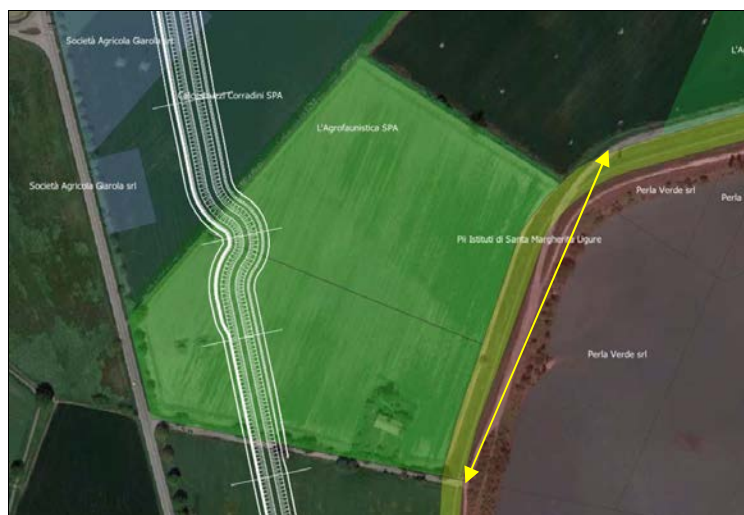
Fig. 2 - Pista camionabile esistente

Si chiede che sia predisposta una servitù di passaggio da utilizzare sino al momento in cui non sia attivata la viabilità sostitutiva a ridosso della nuova arginatura.