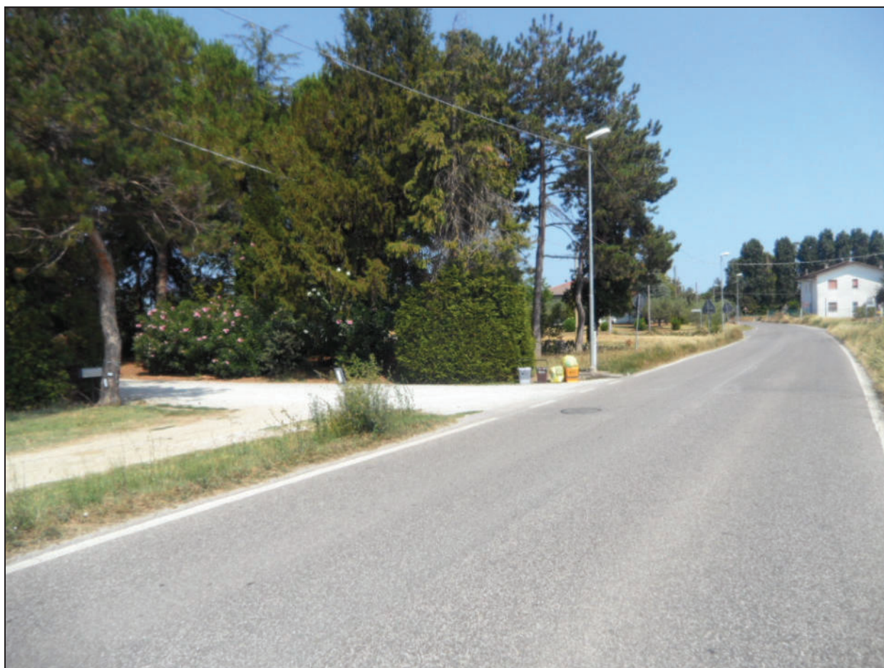
Fotografia -4- da via S.Antonio con vista su passo carraio da mantenere e parco con presenza di numerose piante ad alto fusto