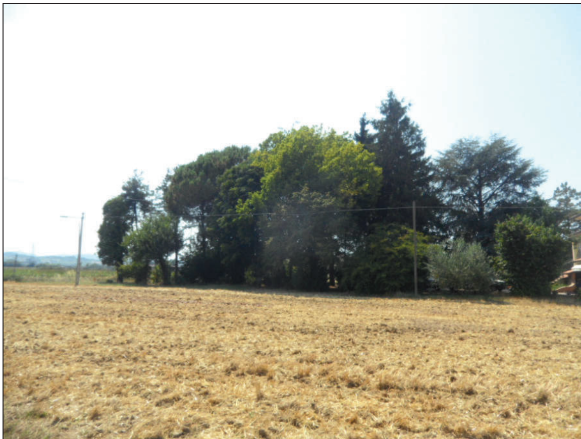
Fotografia -1- da via Termine Due su parco di proprietà con numerose alberature ad alto fusto da voler tutelare