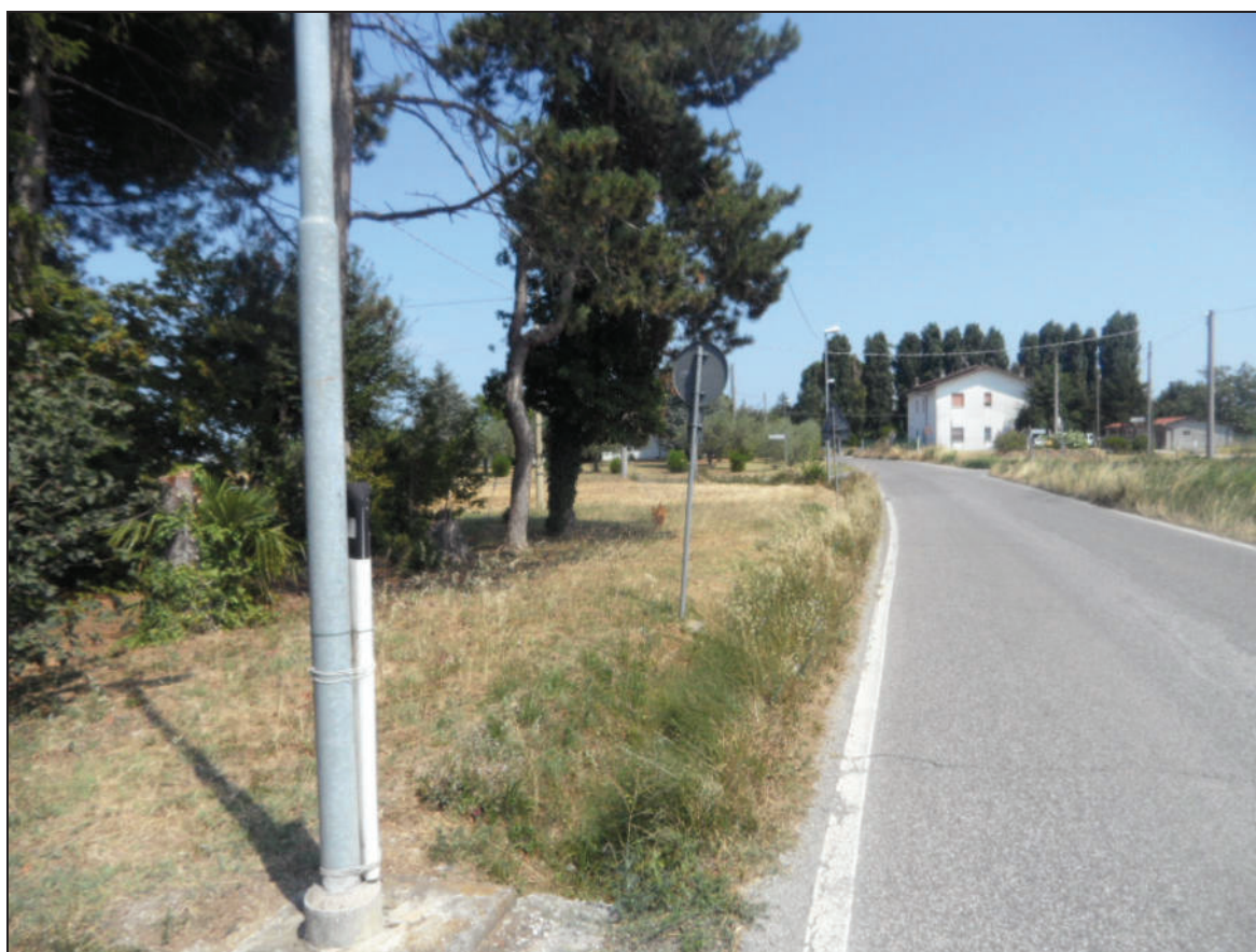
Fotografia -2- da via S. Antonio verso incrocio esistente ove verrà realizzata la rotatoria, sulla sinistra scorcio su parco di proprietà