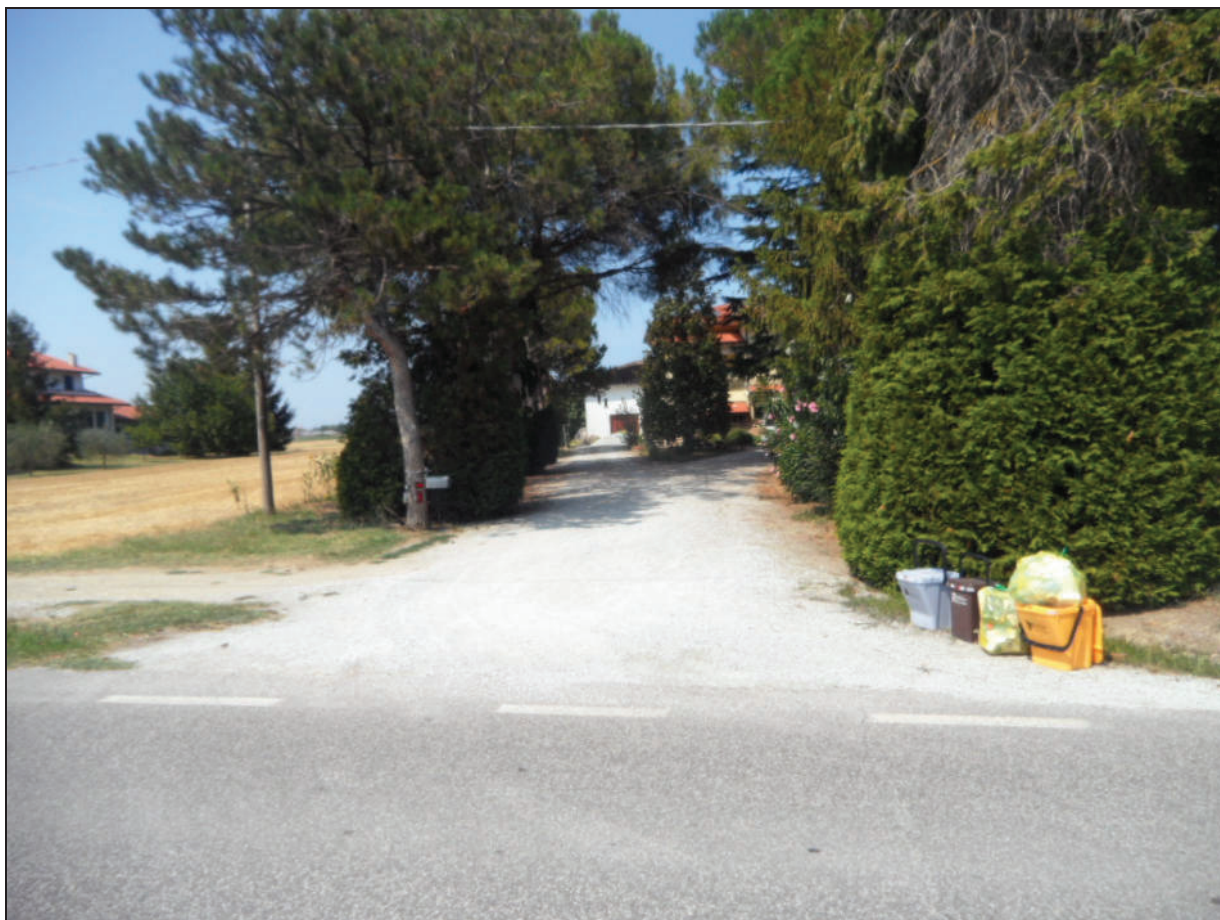
Fotografia -3- da via S.Antonio verso accesso carraio esistente