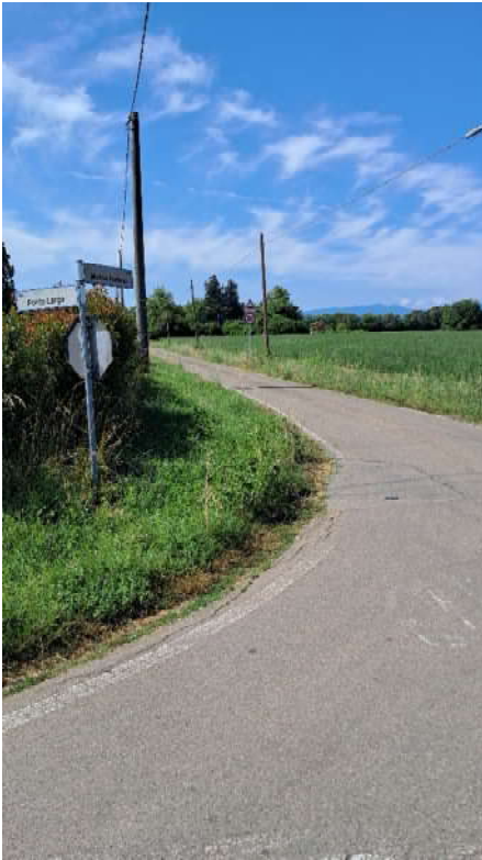
Accesso da Basilicanova Via Al Mulino di Pariano (da sinistra a destra)