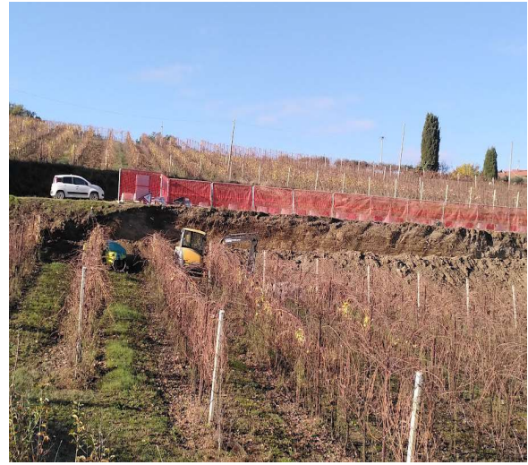
Frane nelle strade di accesso a ridosso del crossodromo

5) Impatto sulla biodiversità: le pareti di sabbie gialle (formazione geologica) distano poche centinaia di metri dal campo di motocross, in queste pareti (spesso ex cave rinaturalizzate) nidificano gruccioni. Sono però state ricoperte da teli per prevenire fenomeni di frana causati anche dai lavori.