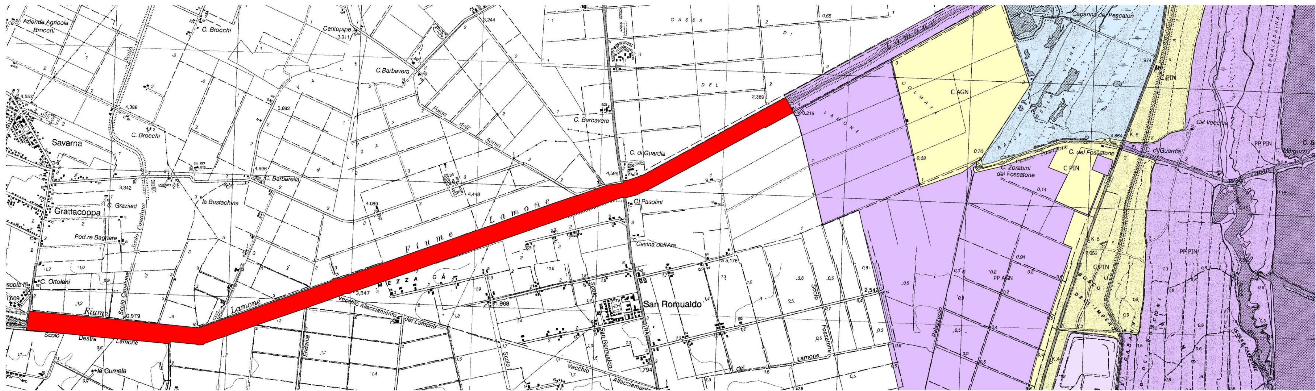
Individuazione area da piantare rispetto al lotto da stralciare dal Piano di Stazione. 1:5000

Estensione del Piano di Stazione lungo il Fiume Lamone in perfetta adesione al Sito Rete Natura 2000 IT4070001 "PUNTE ALBERETE, VALLE MANDRIOLE"