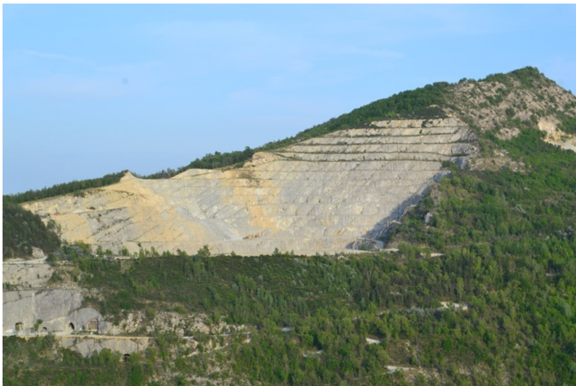
Figura 1-2 - La Cava di Monte Tondo vista da Sasso Letroso