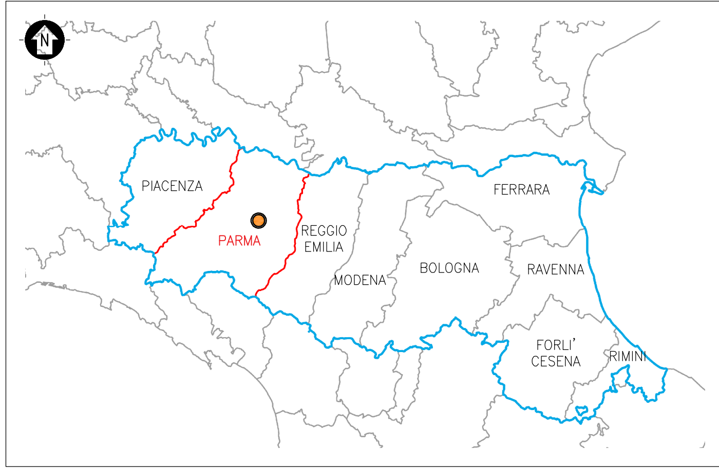
INQUADRAMENTO TERRITORIALE REGIONE EMILIA ROMAGNA – PROVINCIA DI PARMA – SCALA 1:2.000.000