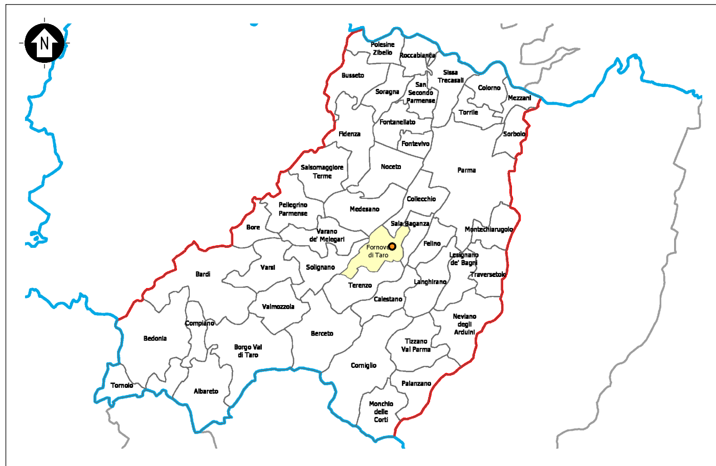
INQUADRAMENTO TERRITORIALE PROVINCIA DI PARMA – COMUNE DI FORNOVO DI TARO – SCALA 1:750.000