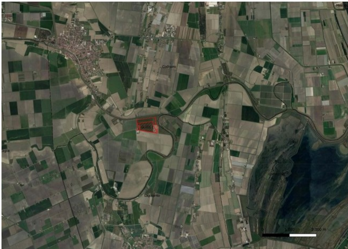
Figura 1: Aerofotogrammetrico – Impianto denominato

Nella figura seguente si riporta la collocazione del sito su vista aerofotogrammetrica (fonte Google Earth Pro ©).