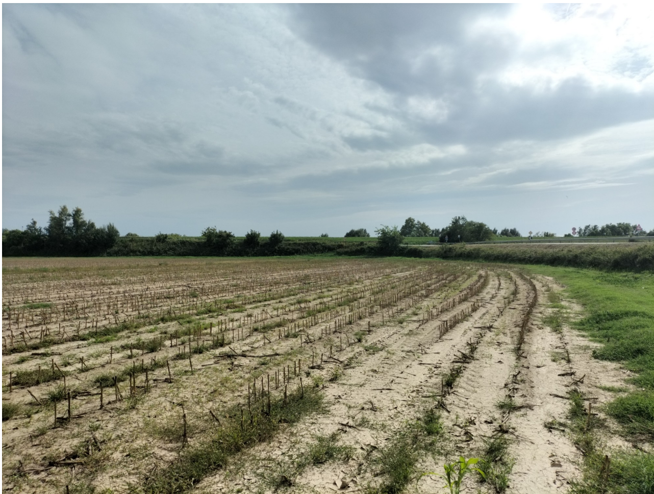
Figura 1: Foto 1