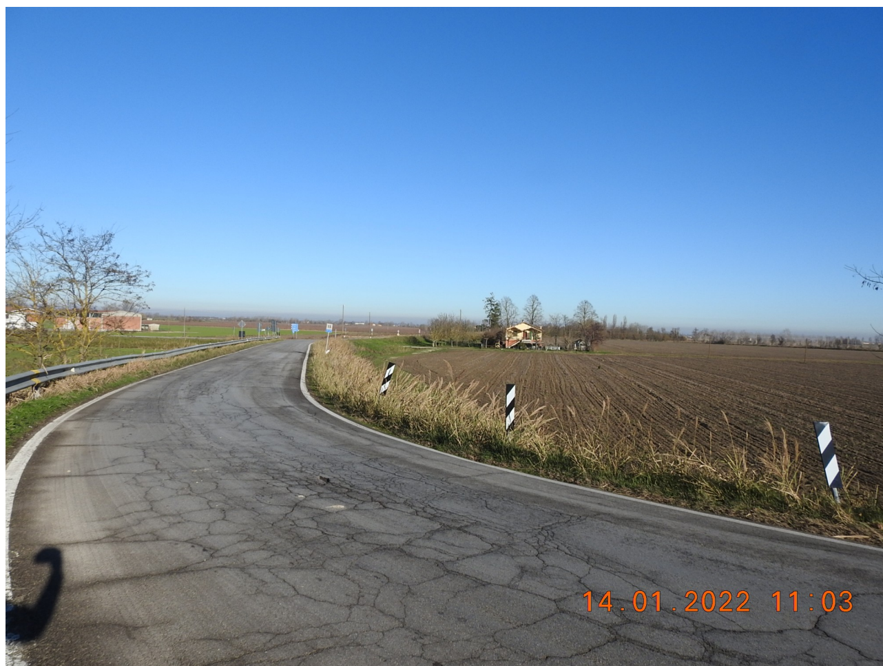
Figura 2: Foto 2