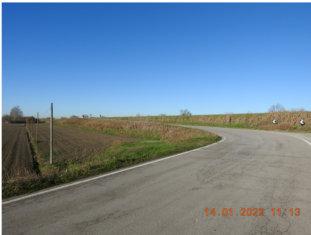
Figura 5: Foto 5