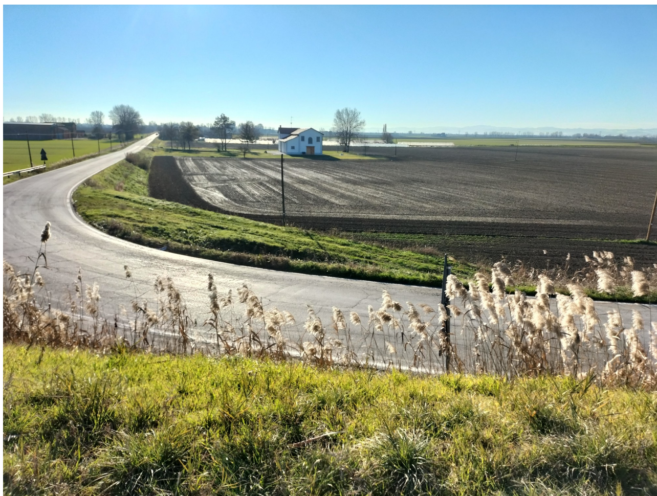
Figura 4: Foto 4