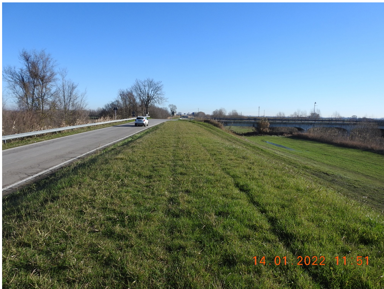
Figura 3: Foto 3