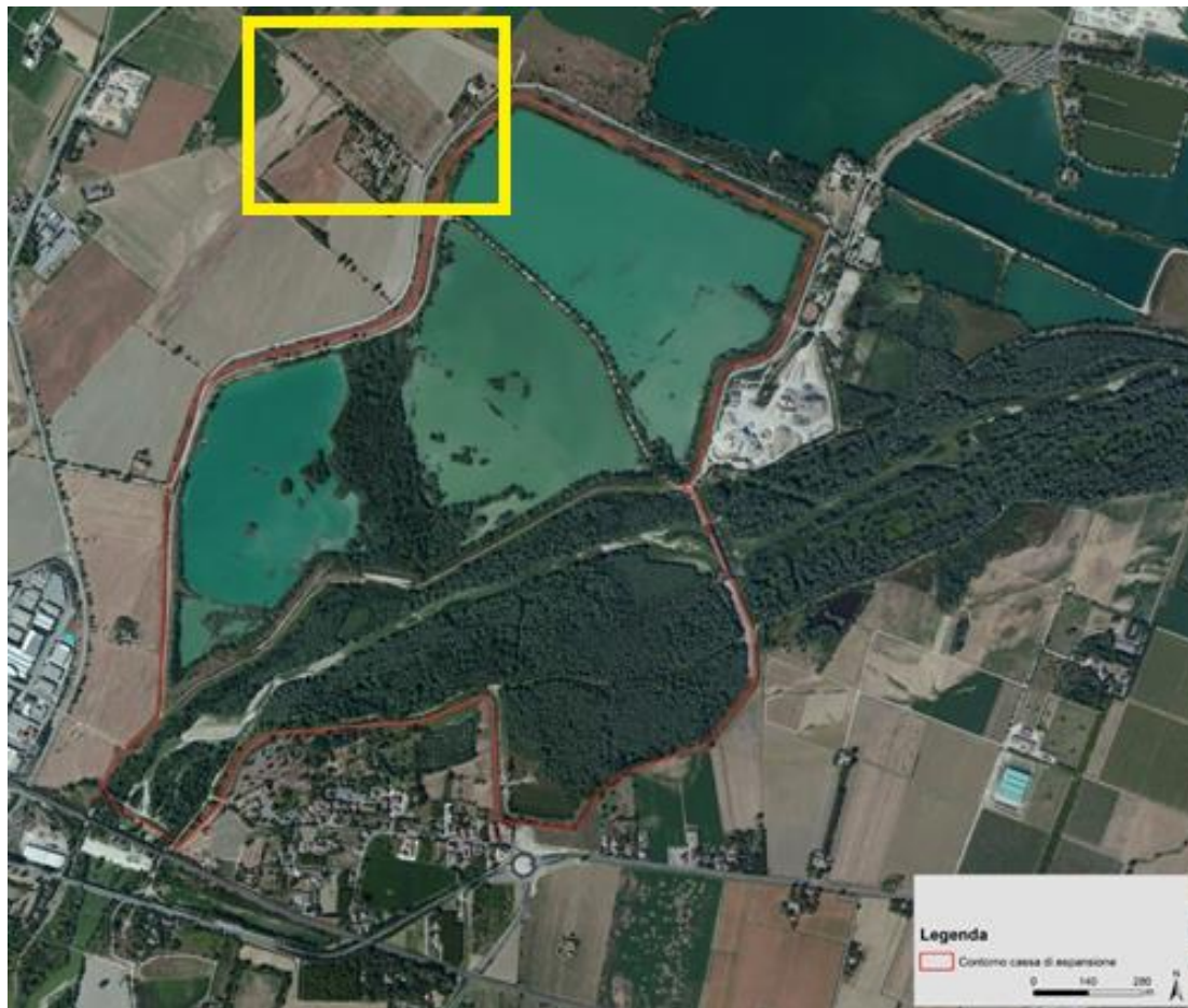
Figura 1. Area di intervento: in rosso è identificato il confine attuale della cassa di espansione; l'area di intervento è evidenziata in giallo

L'area su cui si estende attualmente la cassa di espansione è stata interessata in passato da un'intensa attività estrattiva che ha prodotto, nella parte nord, alcuni crateri di scavo sotto falda, trasformati poi in bacini lacuali.