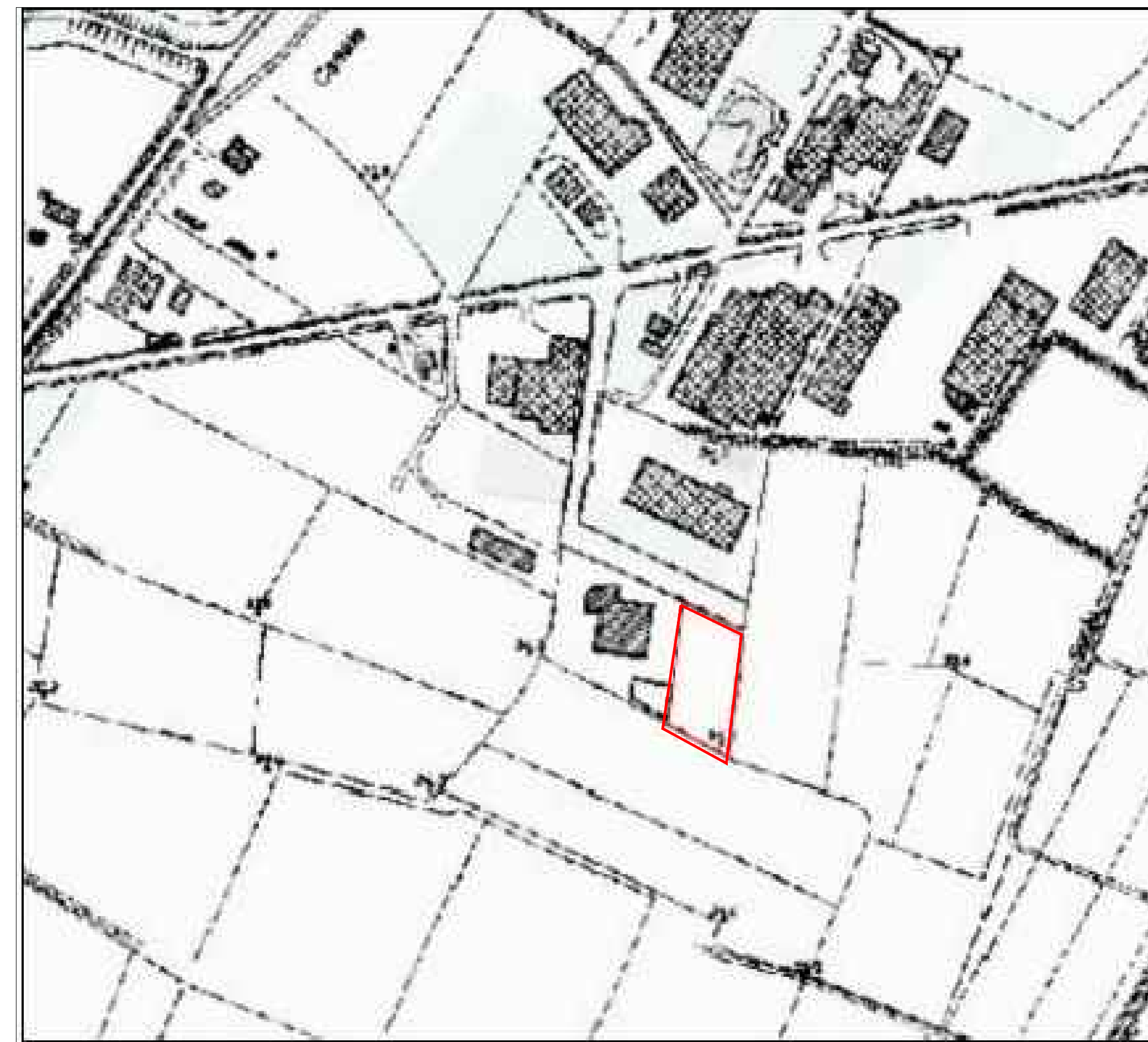
Inquadramento su Carta Tecnica Regionale