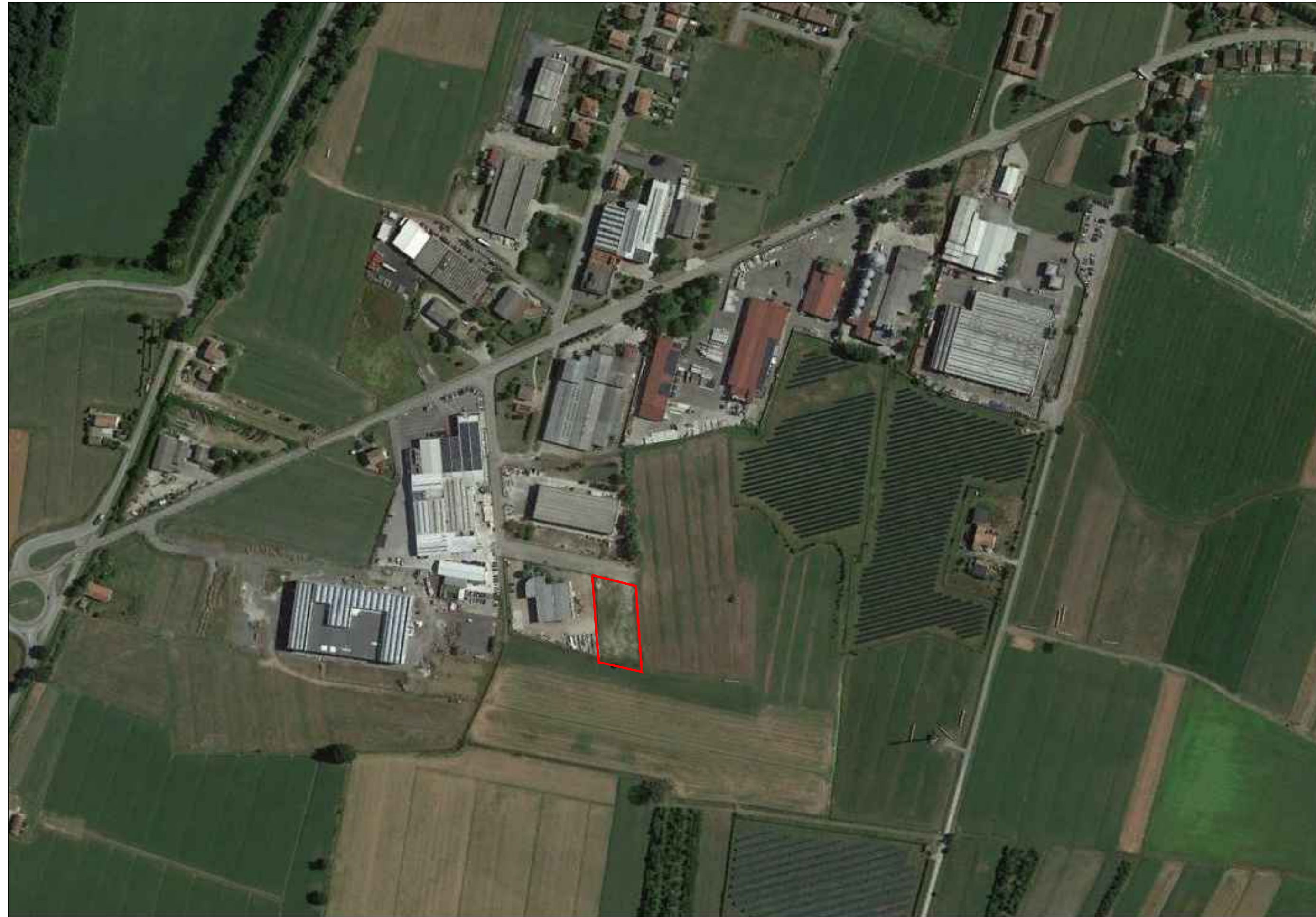
Inquadramento Google Earth