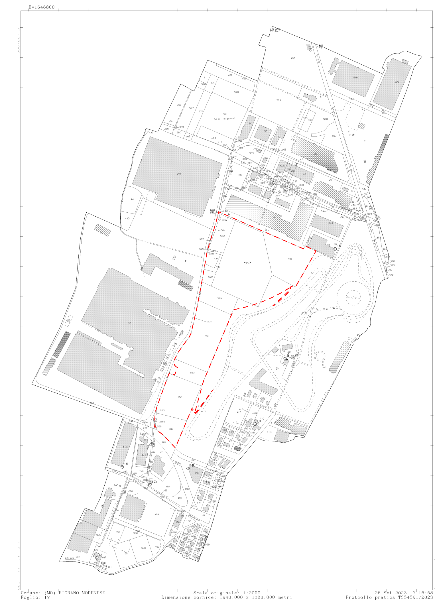
ESTRATTO DI MAPPA CATASTALE