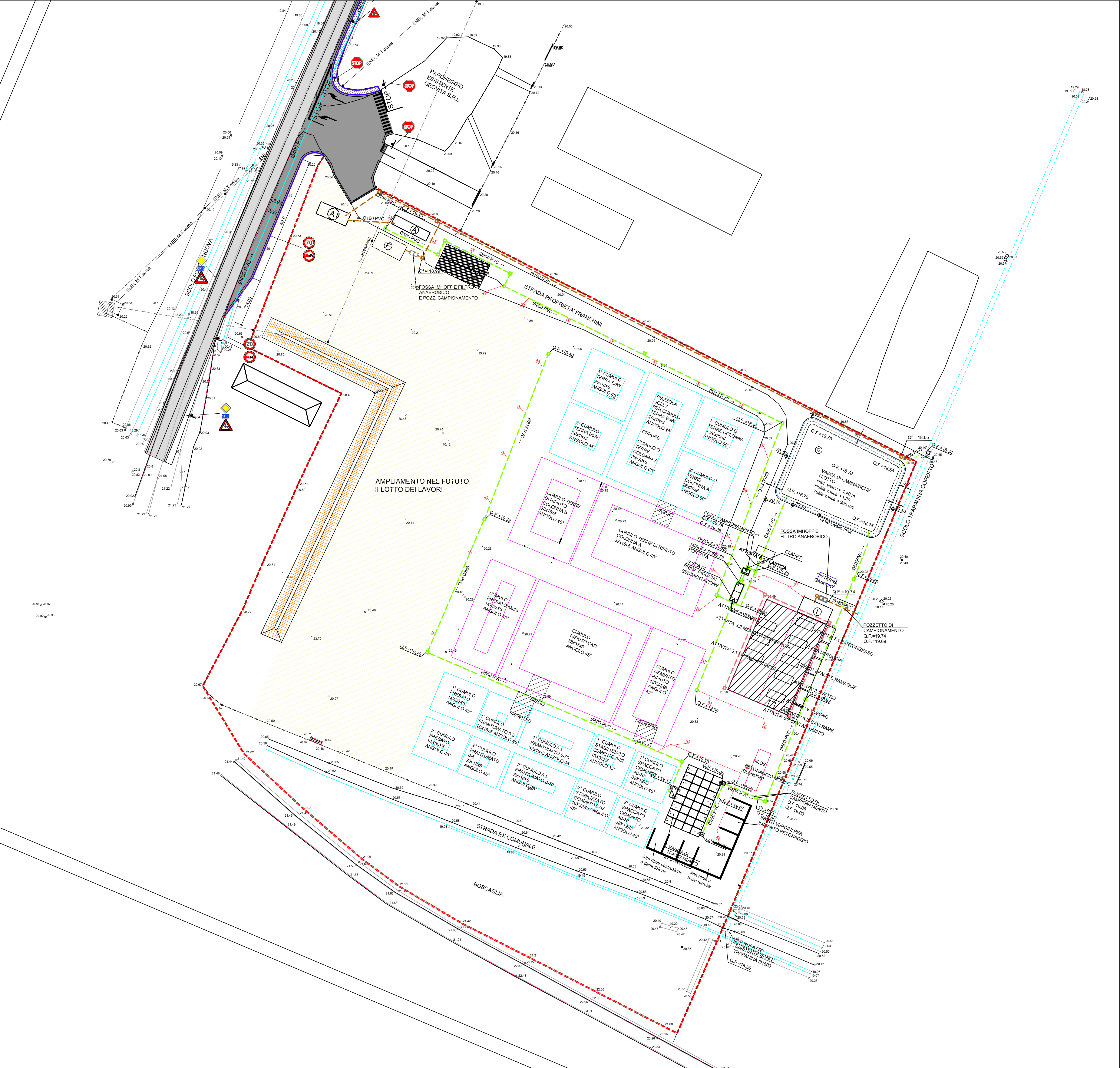
PLANIMETRIA DI PROGETTO 1:500