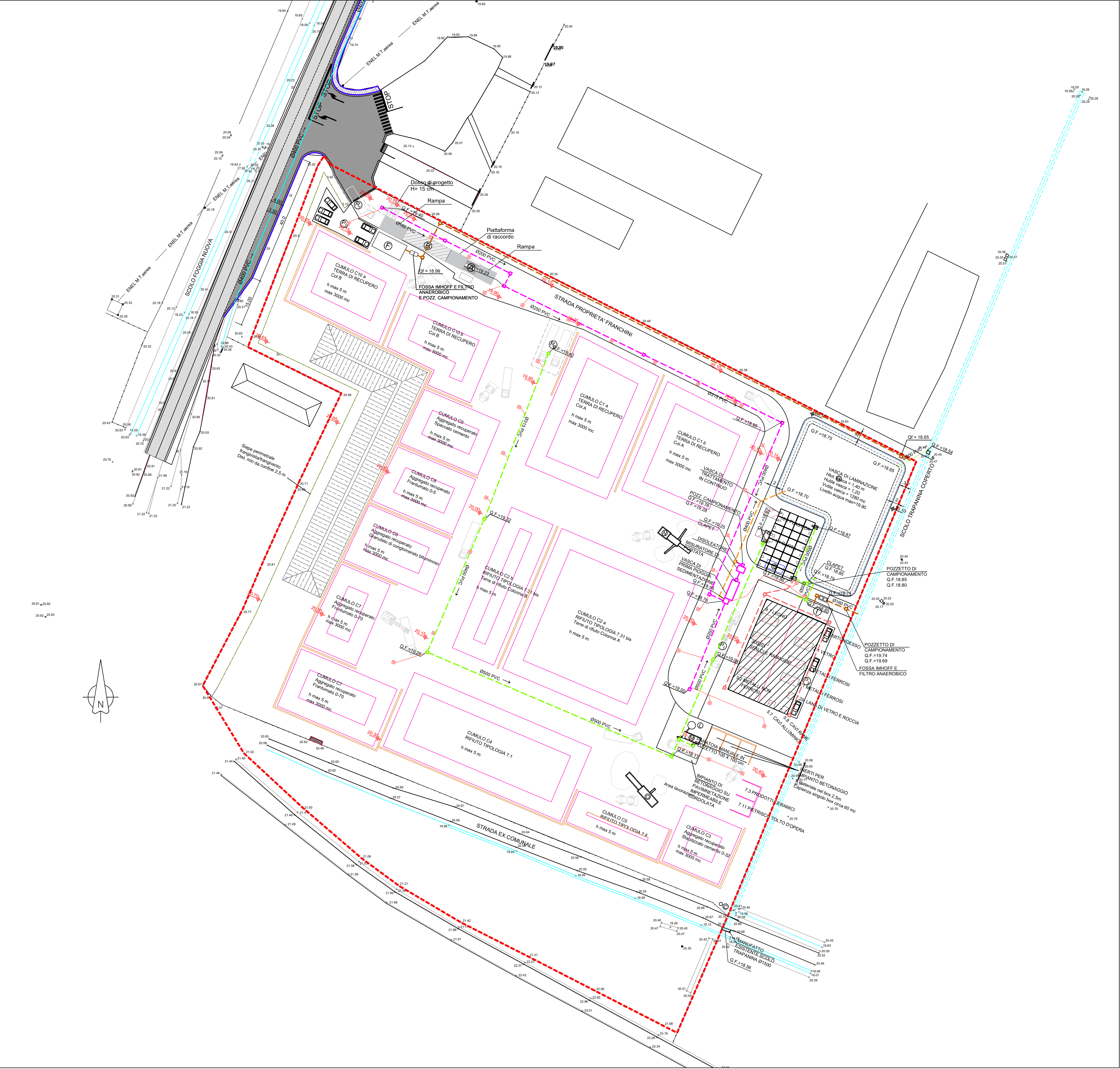
PLANIMETRIA DI PROGETTO 1:500

N.B.: Le ubicazioni plano-altimetriche dei sottoservizi esistenti risultano desunte da indagine specifica condotta presso i rispettivi Enti titolari ma debbono comunque essere considerate indicative rinviandosi, per il loro esatto posizionamento a eventuali ulteriori saggi ed accertamenti specifici in corso d'opera a carico dell'impresa esecutrice. Le indicazioni dei sottoservizi esistenti non fanno riferimento ai vari allacciamenti di utenza.