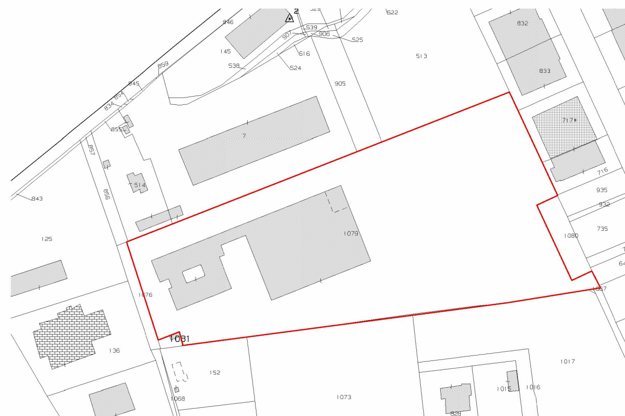
Planimetria Catastale - Scala 1:2.000 NCT Comune di Rimini Foglio 1079