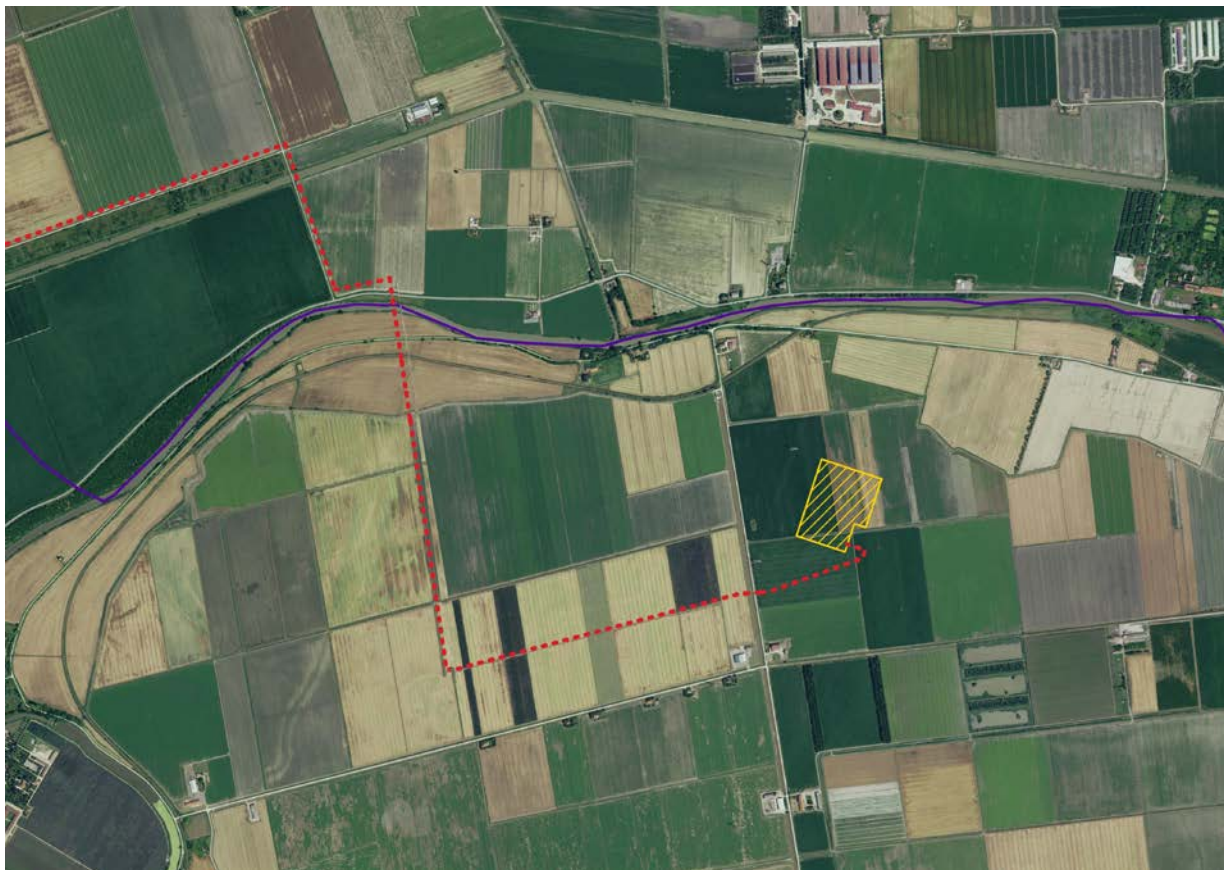
Figura 2. Estratto Ortofoto 2018 con individuata la fascia in cui passerà il collegamento in cavo At 36 kV (fuori scala)