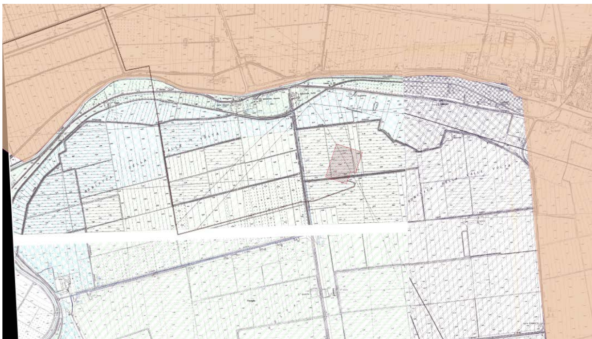
Figura 4. Unione delle Tavole del PRG con sovrapposto il tracciato del Cavidotto e quindi l'area oggetto di Variante al PRG

Per una miglior comprensione delle aree interessate dal tracciato del cavidotto, si rimanda all'elaborato in scala 1:5.000.