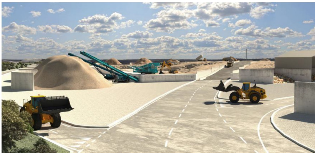
Fig. 4.3 – Ipotesi svolgimento attività nel futuro impianto

La sistemazione delle aree viene inoltre illustrata nei rendering riportati nella Relazione Tecnica, come ad es. il seguente, da cui è facilmente individuabile l'estensione degli interventi di impermeabilizzazione.