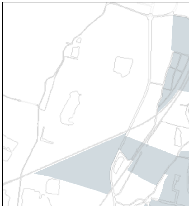
Perimetro del territorio urbanizzato

In merito al Piano Regionale di Gestione dei Rifiuti e per la Bonifica delle aree inquinate 2022-2027 (PRGR), approvato dalla Regione Emilia-Romagna con Deliberazione assembleare n. 87 del 12 luglio 2022 - che prevede all'art. 7 che sia compito degli strumenti di pianificazione provinciale individuare, in attuazione dei criteri contenuti nel Piano, le zone idonee e quelle non idonee alla localizzazione degli impianti di recupero e smaltimento ai sensi dell'articolo 197 del D.Lgs. 152/2006 - si ritiene opportuno che siano esaminati i criteri localizzativi elencati nel Piano al Capitolo 12 della "Relazione Generale".