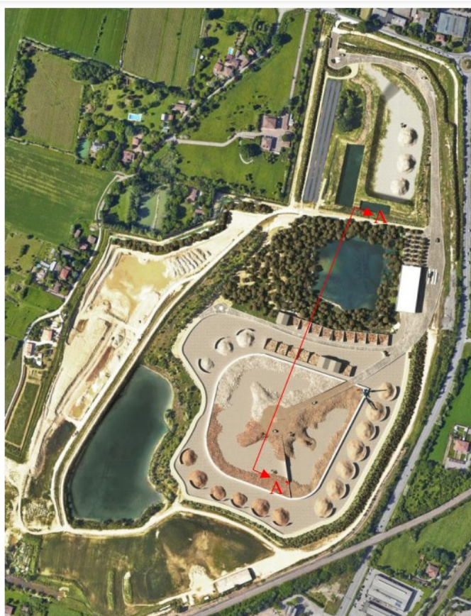
Estratto dalla Relazione Generale

Il progetto ora proposto da Ecofelsinea prevede una vasta area impermeabilizzata, coincidente prevalentemente con le aree in cui è previsto il consolidamento del prato stabile, con cumuli e aree di stoccaggio, un grande fabbricato con uffici nella zona centrale, vasche di laminazione a cielo aperto e Deposito EoW e materie prime in corrispondenza della ex cava Colombo, nonché un'estesa viabilità interna lungo tutto il perimetro, anche a margine delle aree verdi.