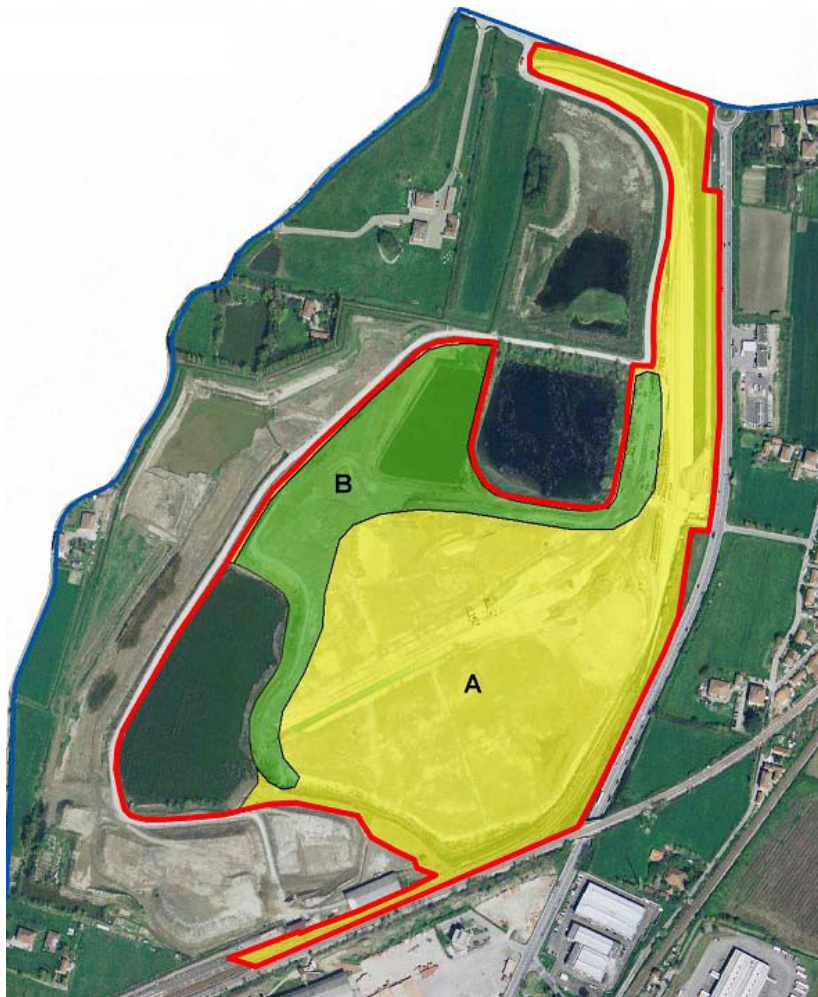
Estratto "Linea Guida per la Sistemazione Finale dell'Area "Corticella": nella zona A la sistemazione è a prato, nella zona B sono previsti impianti arborei-arbustivi.

L'Osservatorio Ambientale, nella seduta del 10/09/2007, ha infatti prescritto lo sviluppo, a cura di RFI ed in accordo con la proprietà del sito, di un progetto di sistemazione finale dell'area da sottoporre ad autorizzazione in sede SUAP del Comune. Tale progetto doveva essere redatto in conformità con le "Linea Guida per la Sistemazione Finale dell'Area "Corticella" emesse dal Comune di Bologna e discusse in sede di Osservatorio Ambientale.