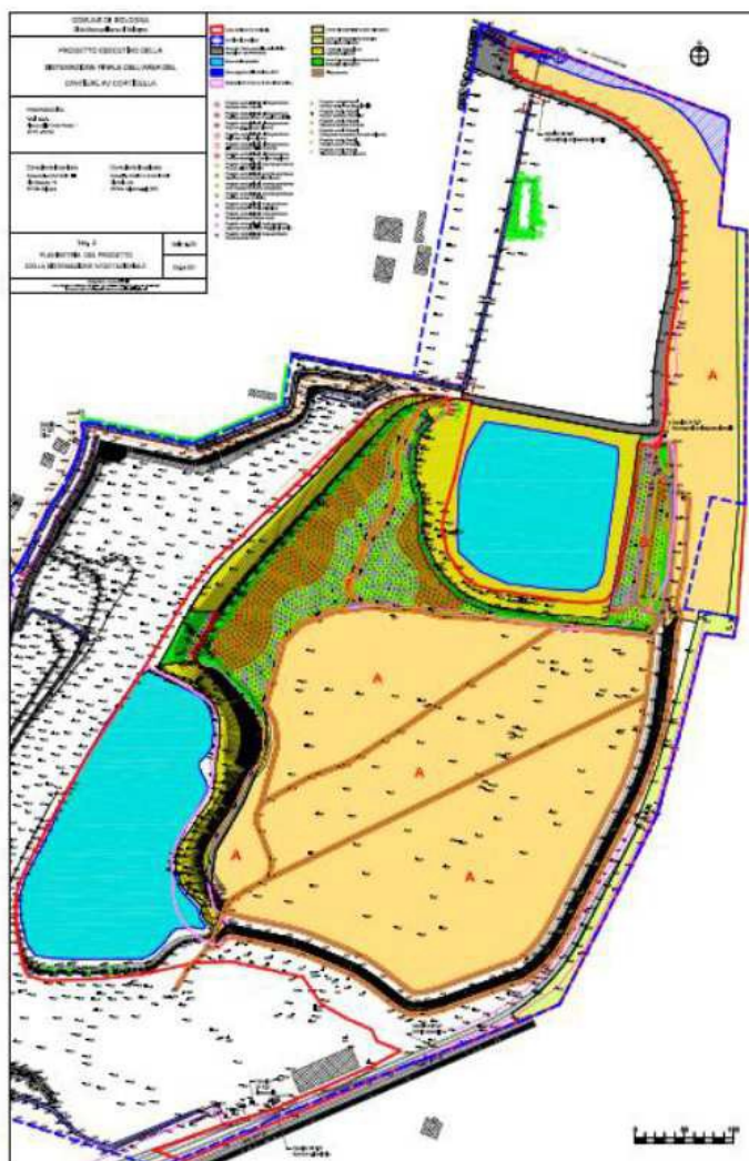
Estratto progetto di sistemazione approvato.

Il progetto di sistemazione presentato da RFI e approvato dal SUAP del Comune di Bologna nel 2022 (per maggiori specifiche si veda anche quanto precedentemente riportato) prevede il consolidamento del prato stabile presente e la messa a dimora di una fascia arborea e arbustiva come dalle Linee guida sopra richiamate.