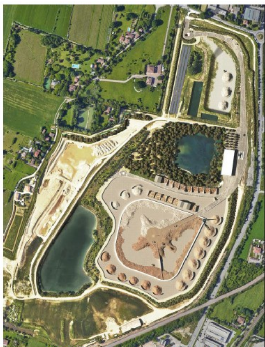
Fig. 4.4 – Ipotesi planimetria futuro impianto

L'area in esame è ubicata esternamente al perimetro del territorio urbanizzato. Il progetto prevede l'impermeabilizzazione di quasi 40.000 mq, pertanto è necessario un confronto con i principi generali della LR 24/2017 - Disciplina regionale sulla tutela e l'uso del territorio, ed in particolare dell'art. 5, che correla direttamente il consumo di suolo all'impermeabilizzazione dello stesso.