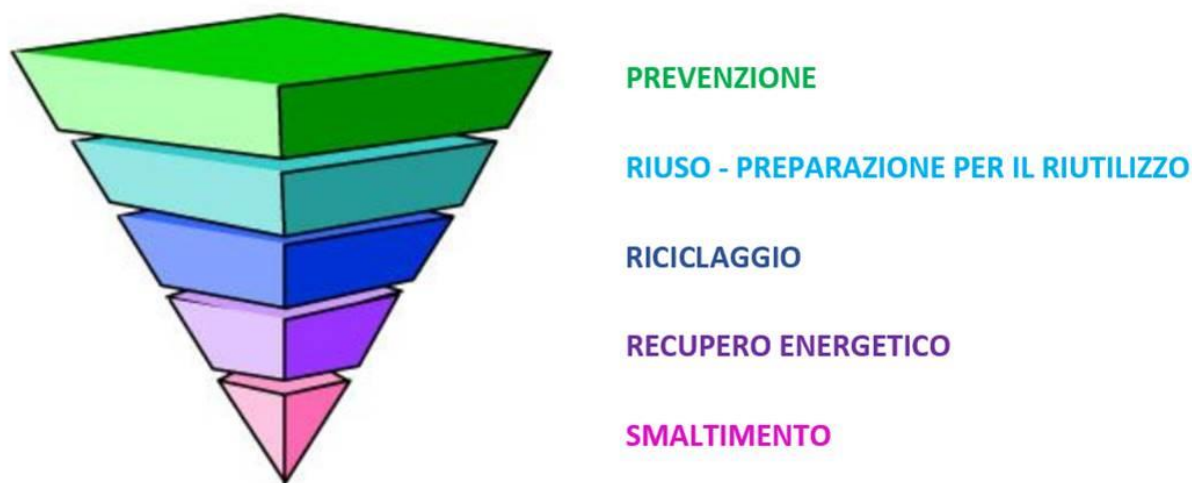
Figura 1: Gerarchia comunitaria di gestione dei rifiuti

In relazione alla produzione totale dei rifiuti urbani si registra nel 2019 un leggero calo rispetto alla base-line di Piano, ma si è ancora distanti dal raggiungimento degli obiettivi previsti al 2020. Questa evidenza, anche in relazione alla grande fluttuazione delle variabili economiche per effetto dell'emergenza COVID-19, necessita di riflessioni approfondite rispetto alla valutazione dei nuovi obiettivi di prevenzione.