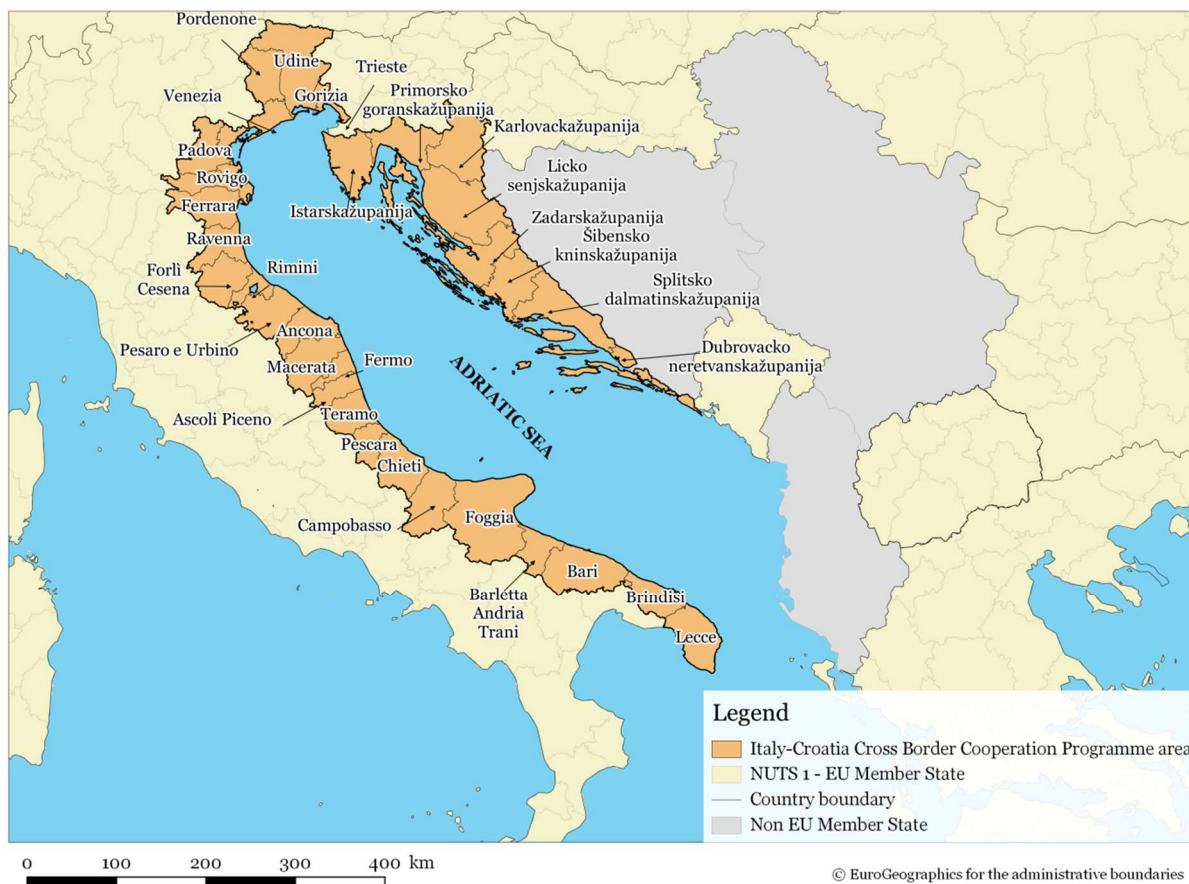
Figura 2 - INTERREG V A Italia – Croazia 2014-2020 area di programma