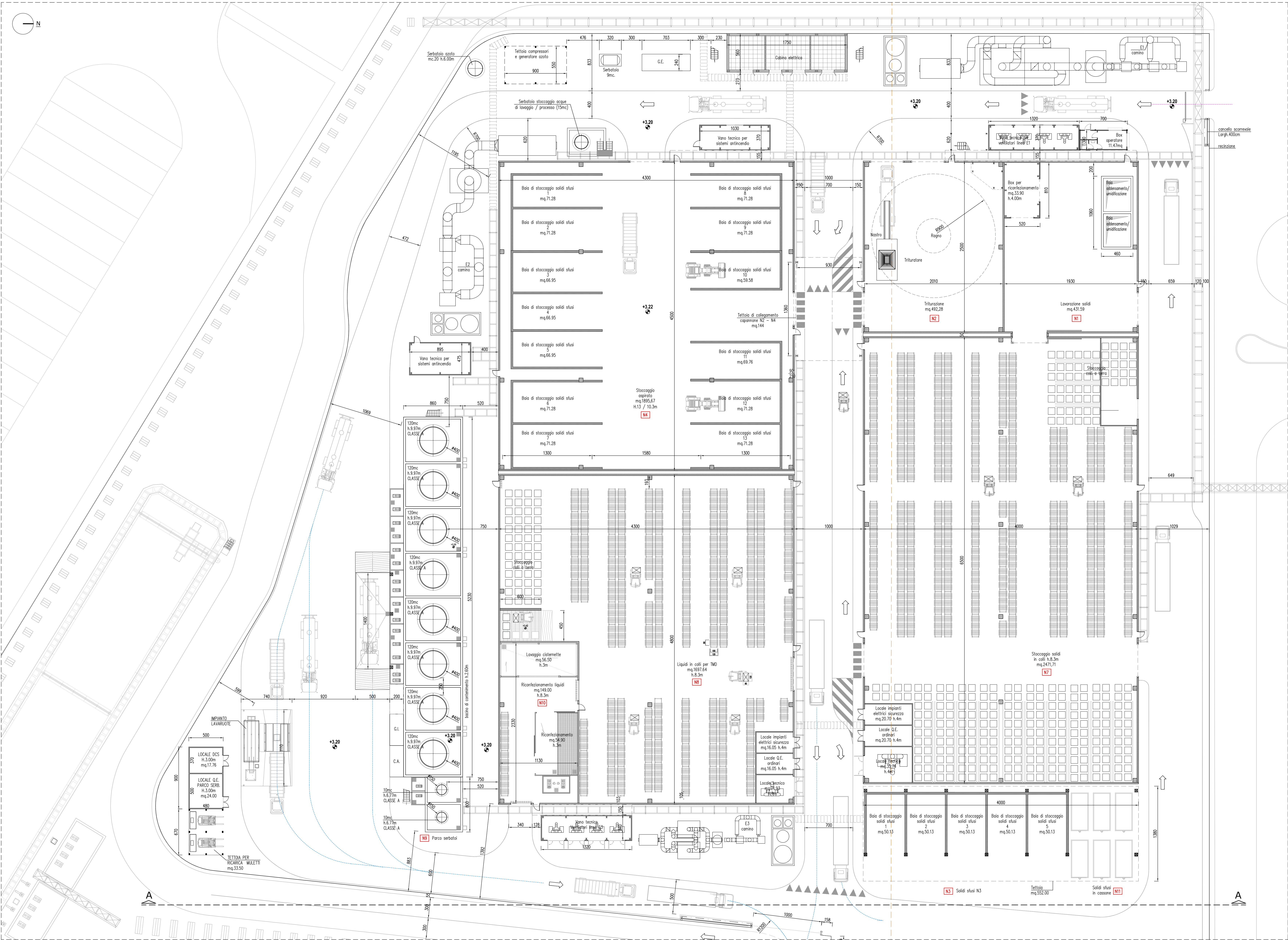
PLANIMETRIA GENERALE Scala 1:200