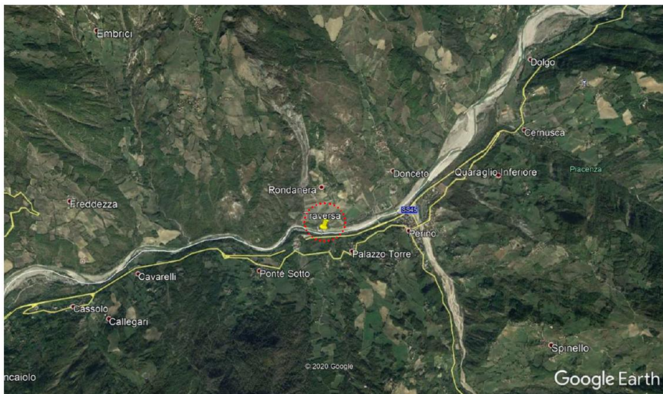
Figura 1 - Localizzazione delle opere su ortofoto in Google Earth