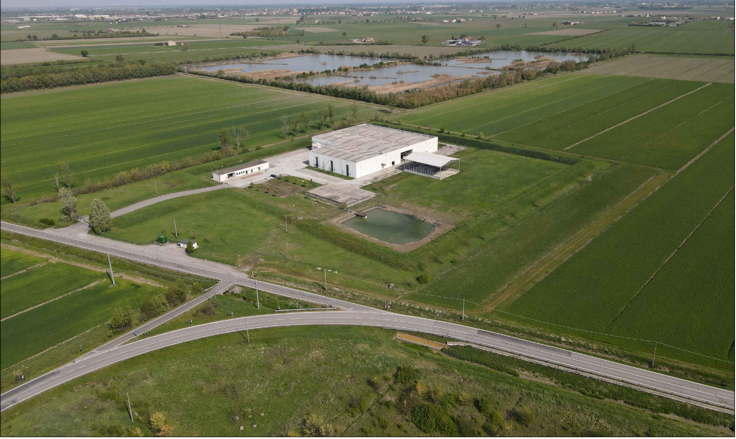
STATO DI FATTO - VISTA 4