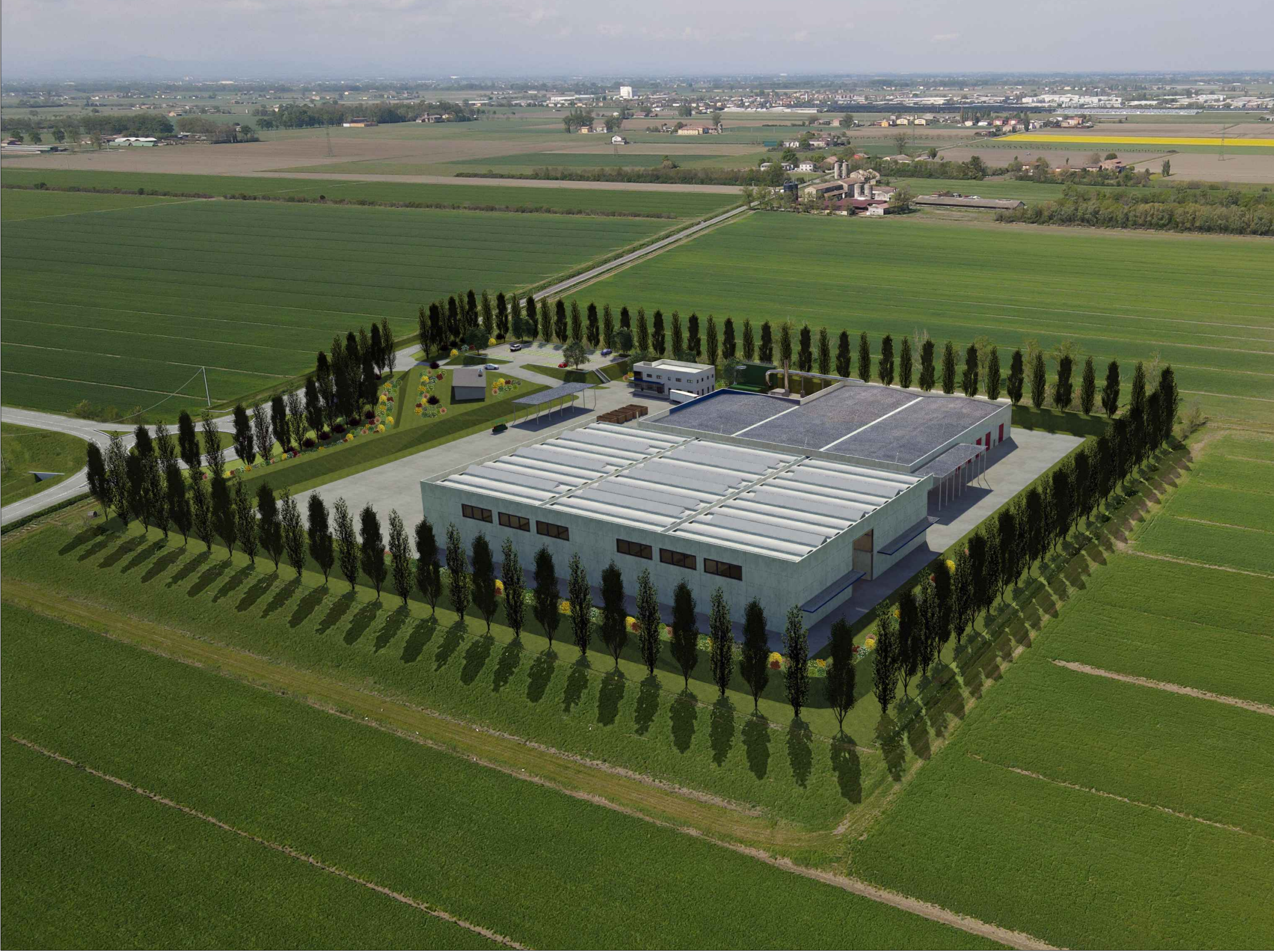
STATO DI PROGETTO - VISTA 2