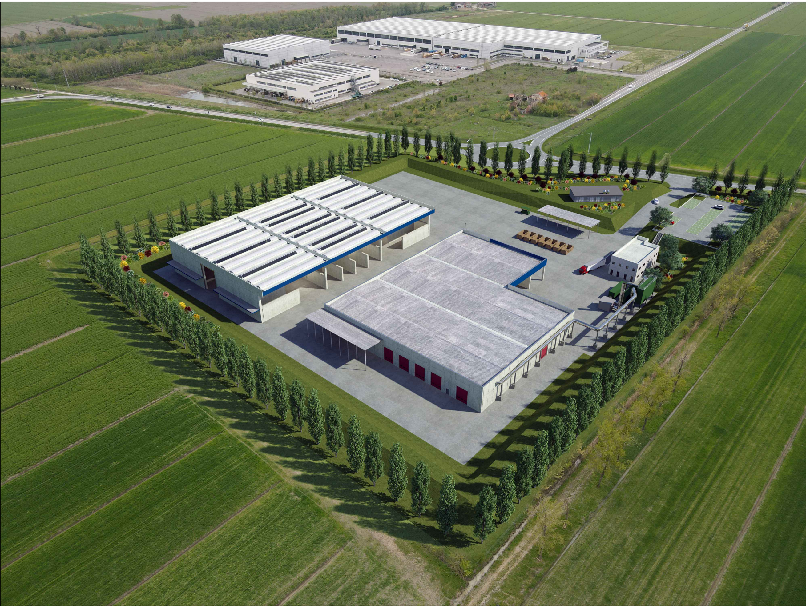
STATO DI PROGETTO - VISTA 2