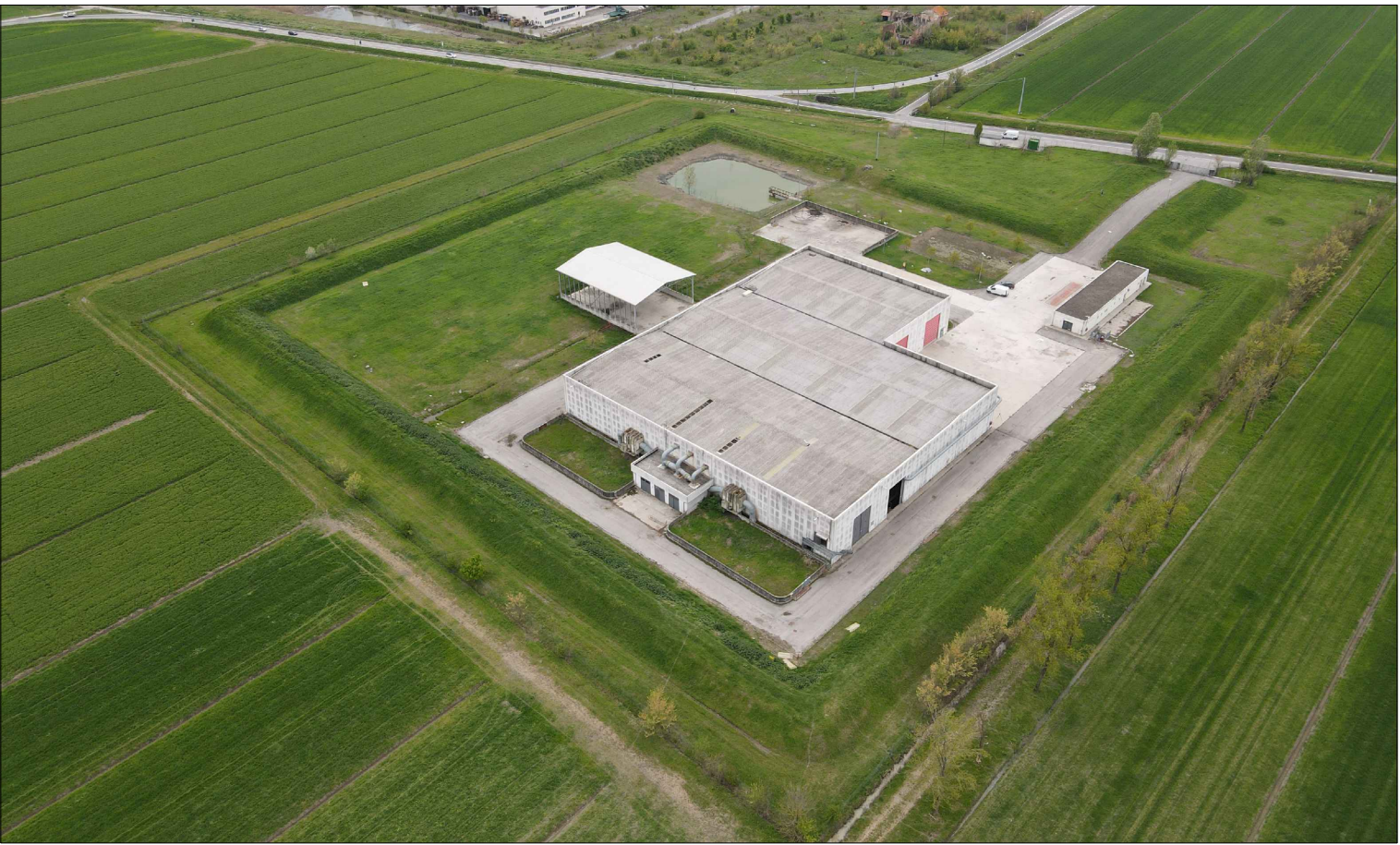
STATO DI FATTO - VISTA 2