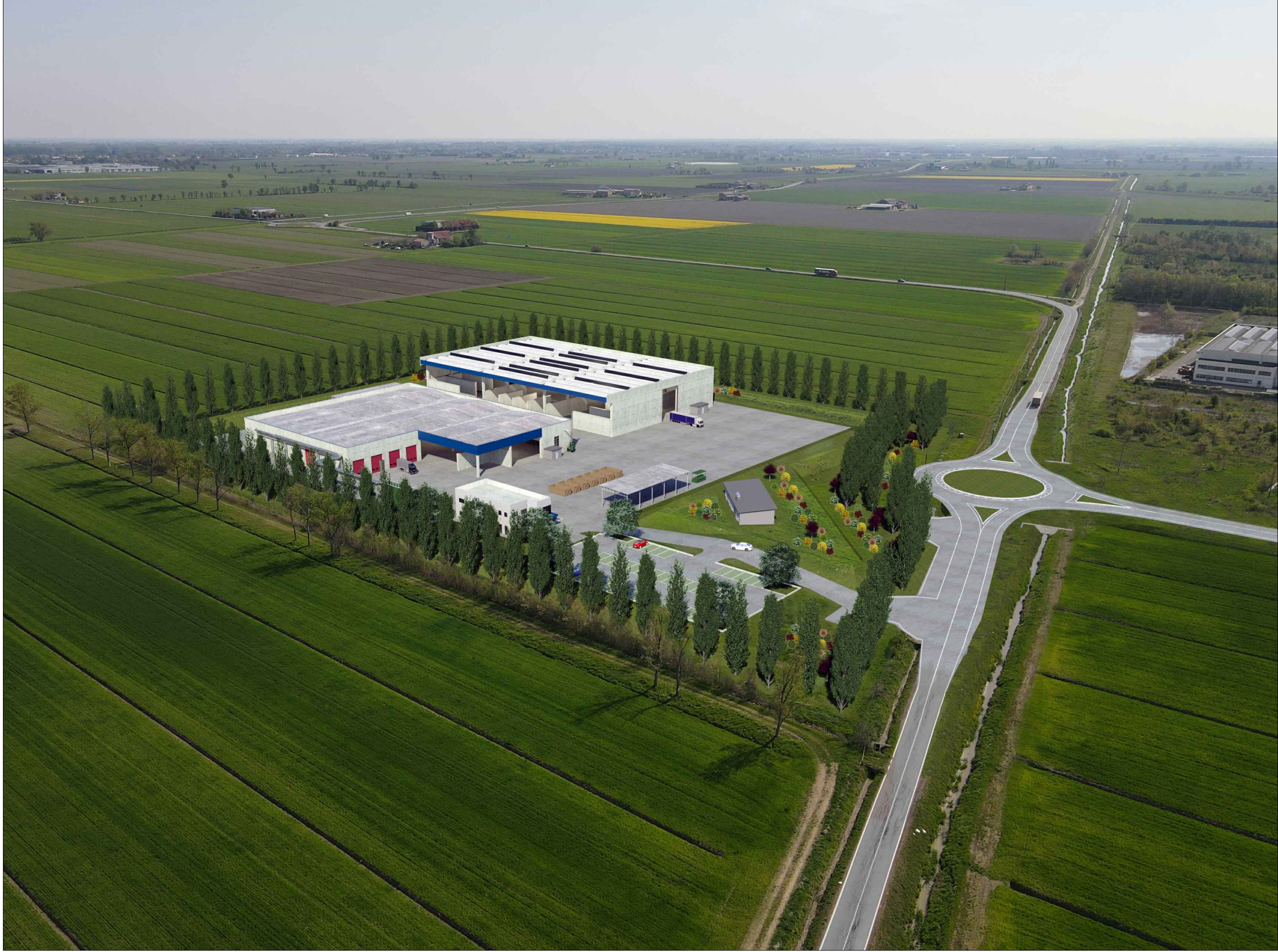
STATO DI PROGETTO - VISTA 4