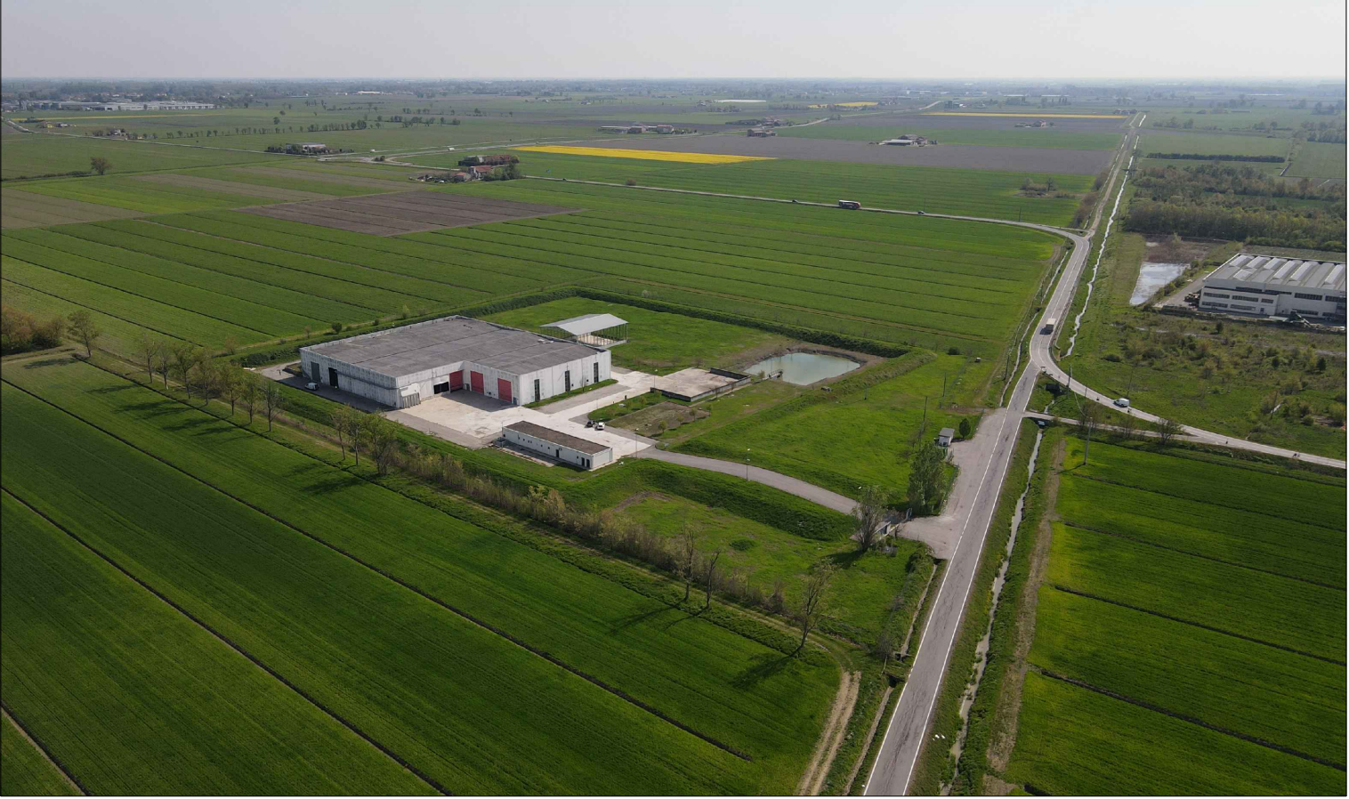
STATO DI FATTO - VISTA 4