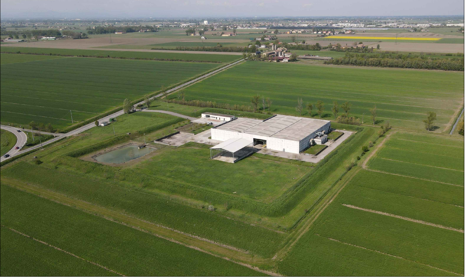
STATO DI FATTO - VISTA 3