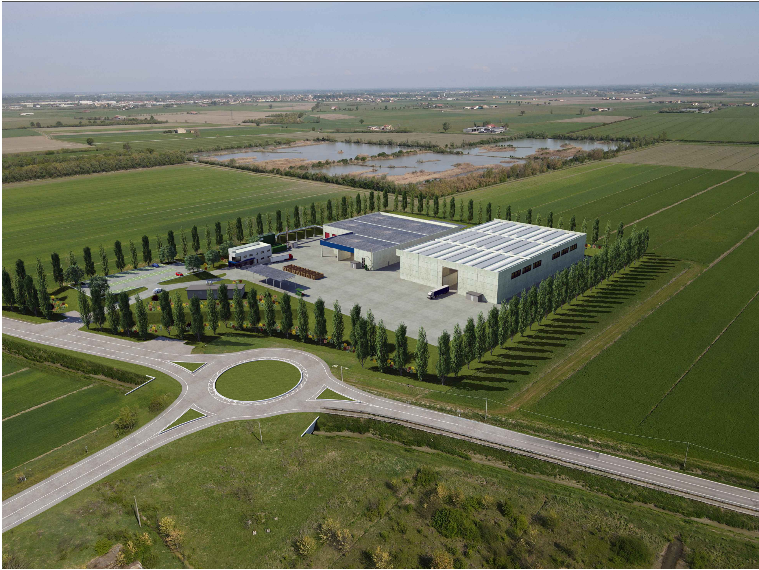
STATO DI PROGETTO - VISTA 4