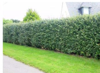
Elagnus x ebbingei