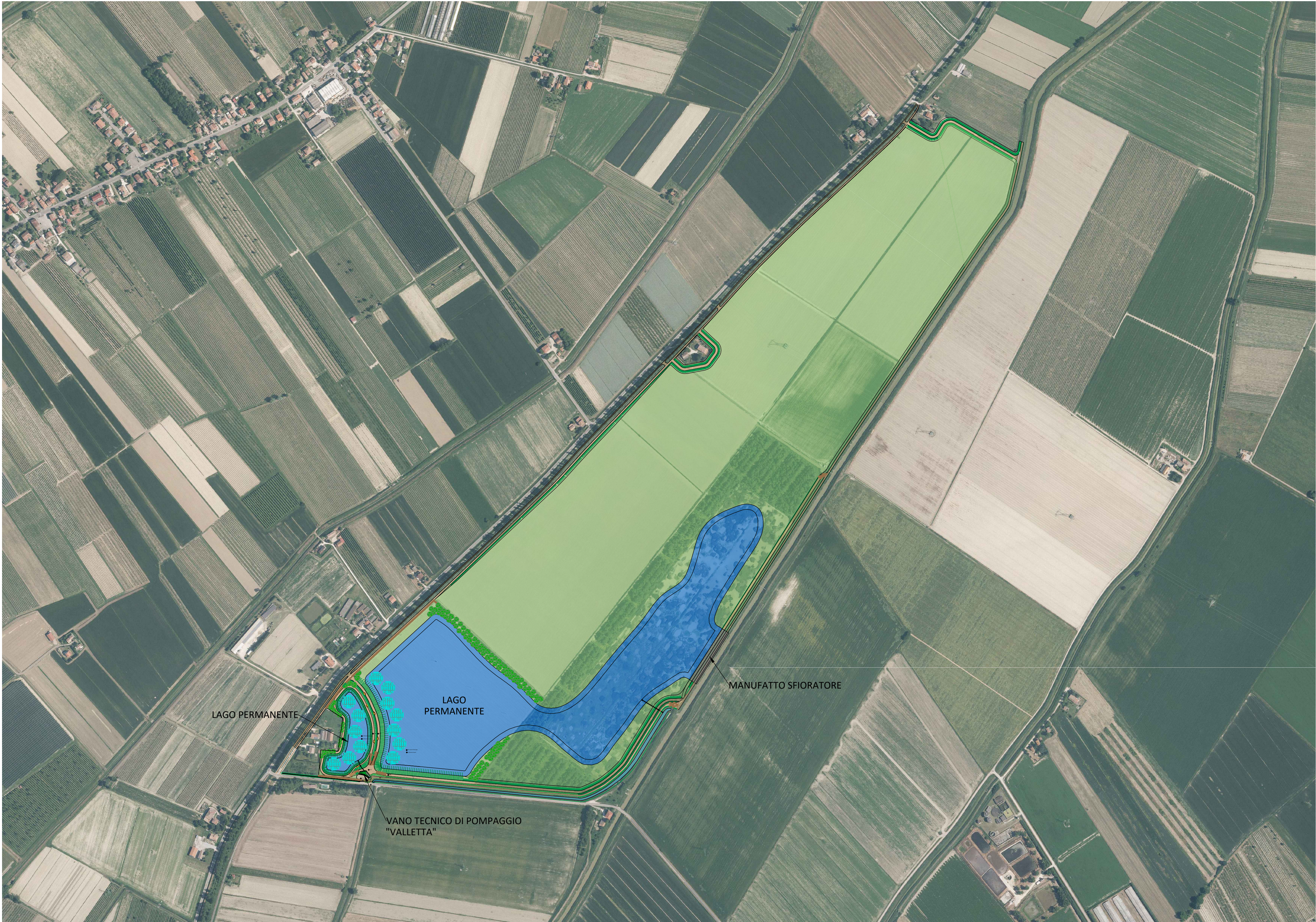
PLANIMETRIA GENERALE SCALA 1:5000