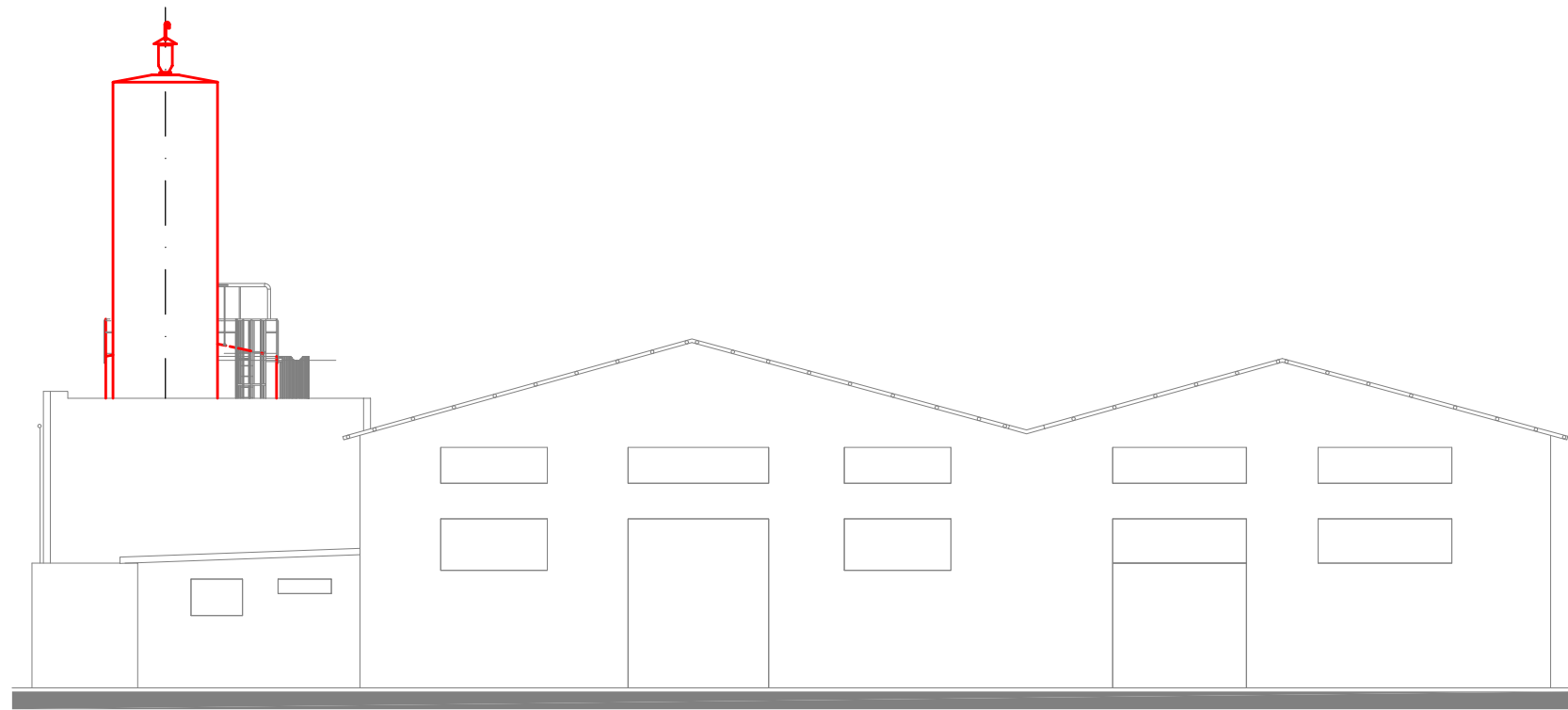
PROSPETTO EST - Scala 1:200