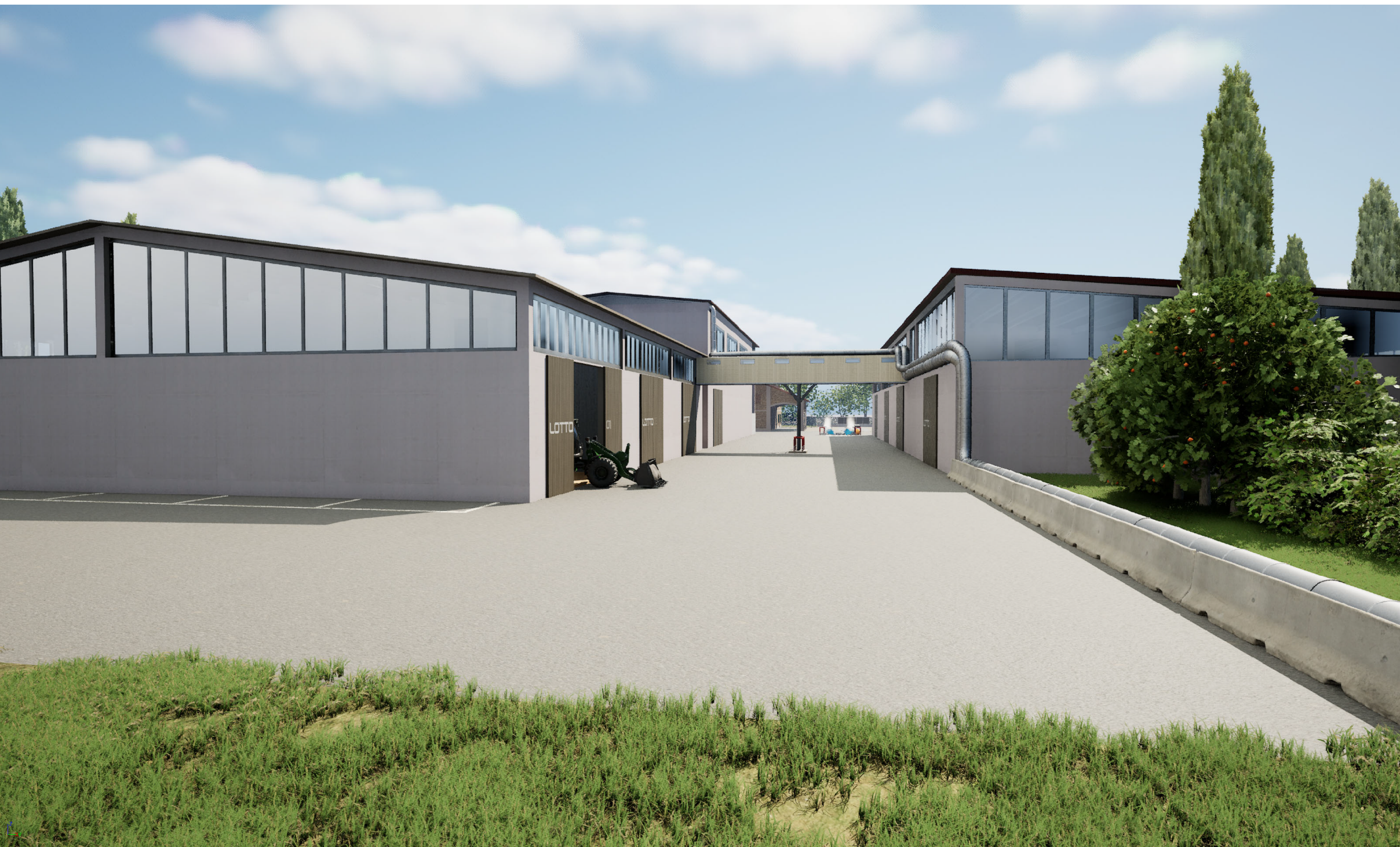
VISTA INTERNA - CORRIDOIO FRA I DEPOSITI