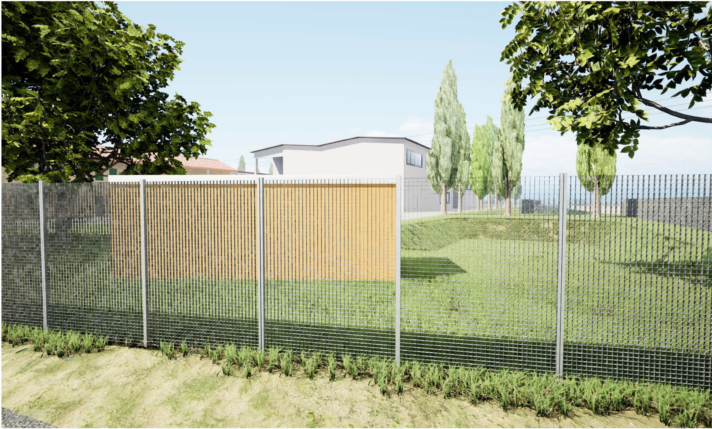
VISTA DA VIABILITA' COMUNALE - VIA PORTONI BANDISSOLO