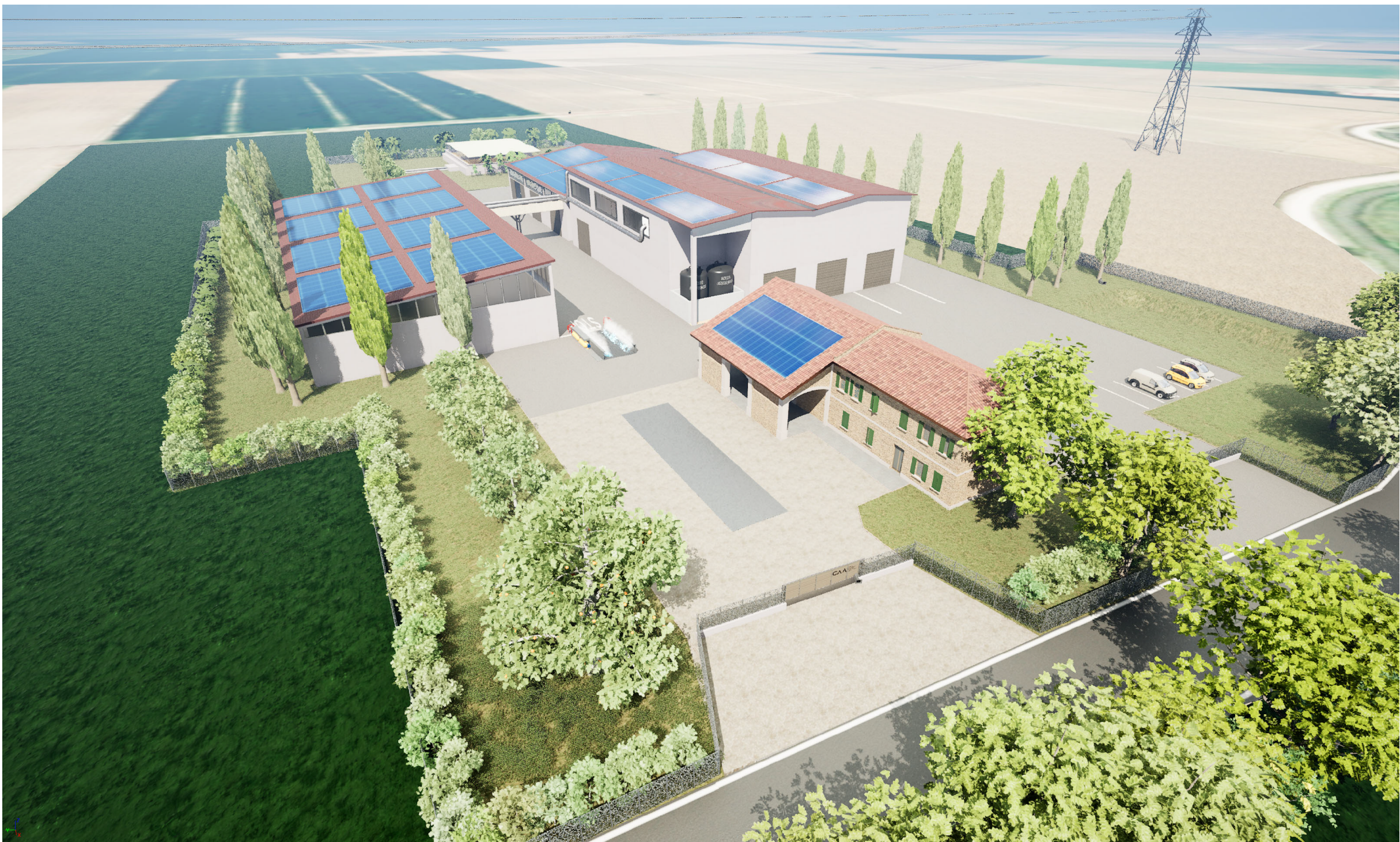
VISTA DALL'ALTO - EST