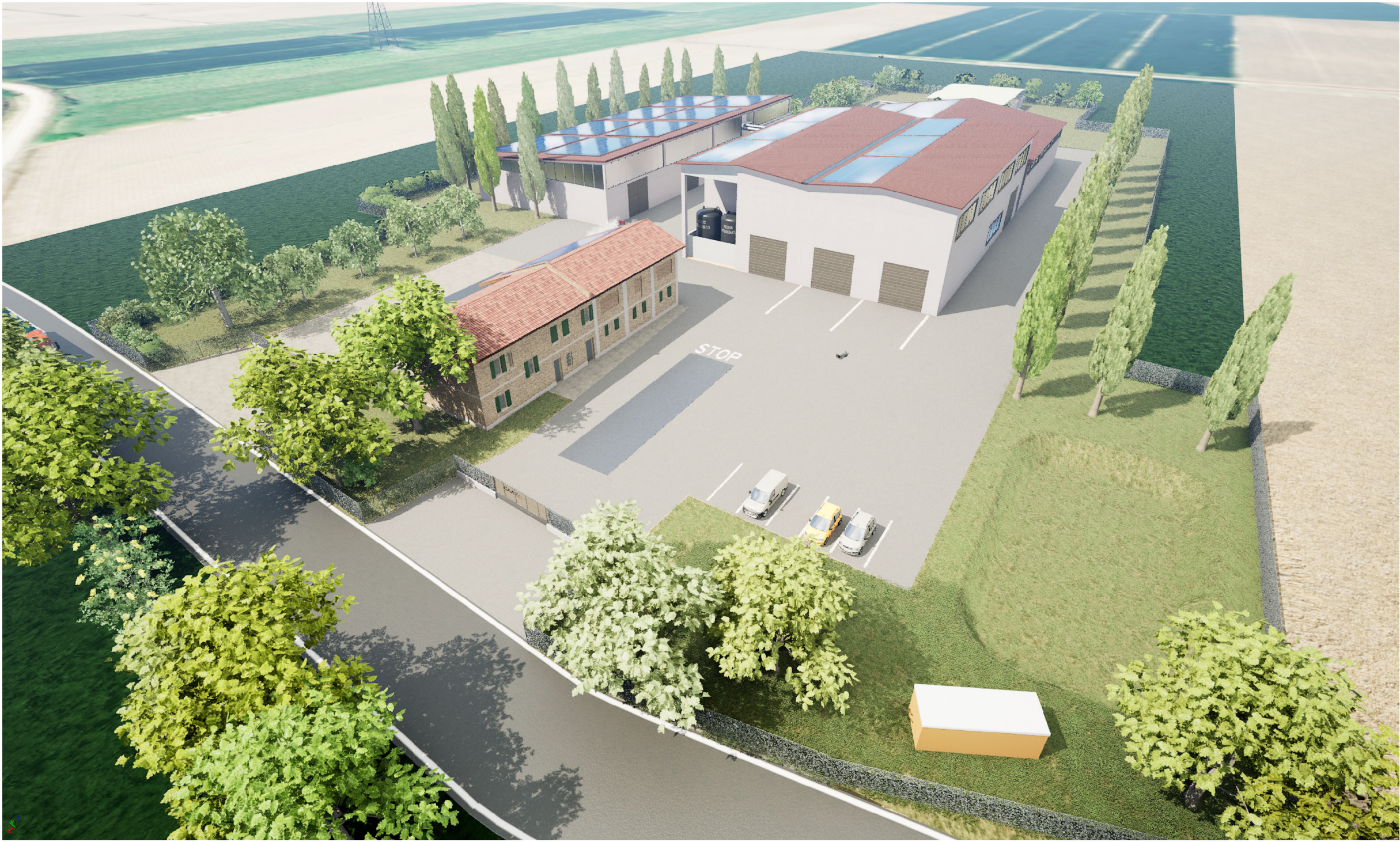
VISTA DALL'ALTO - NORD-EST