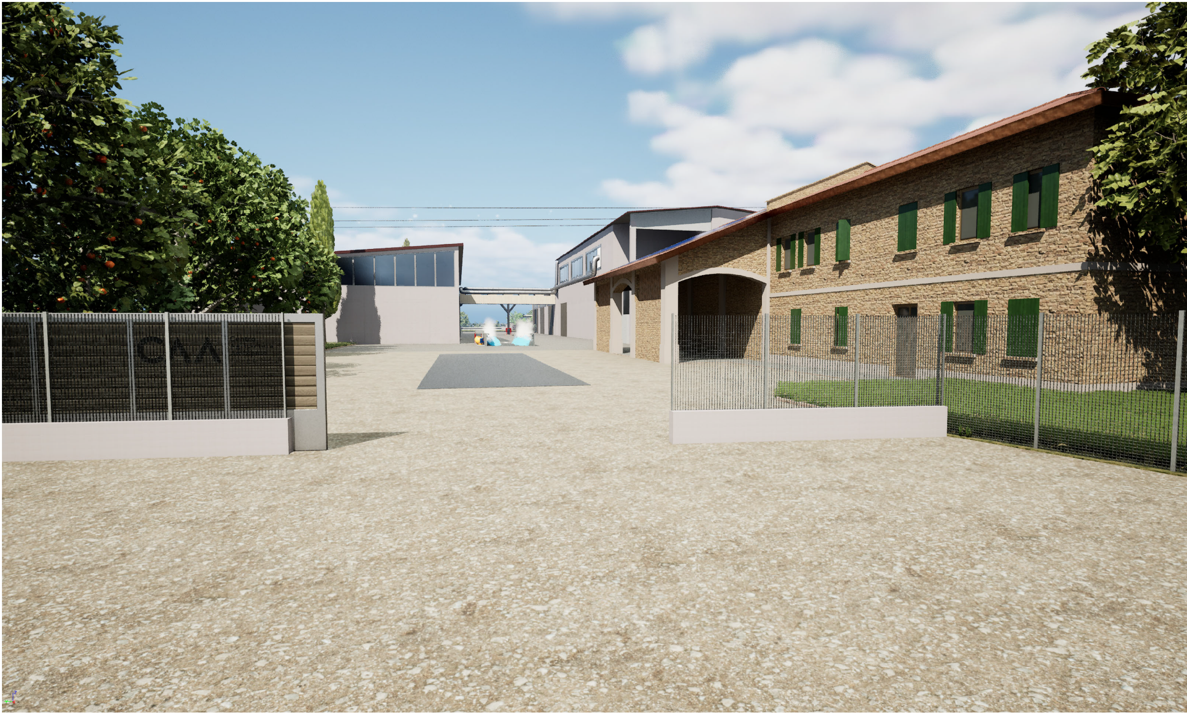
VISTA ACCESSO CARRAIO "SUD"