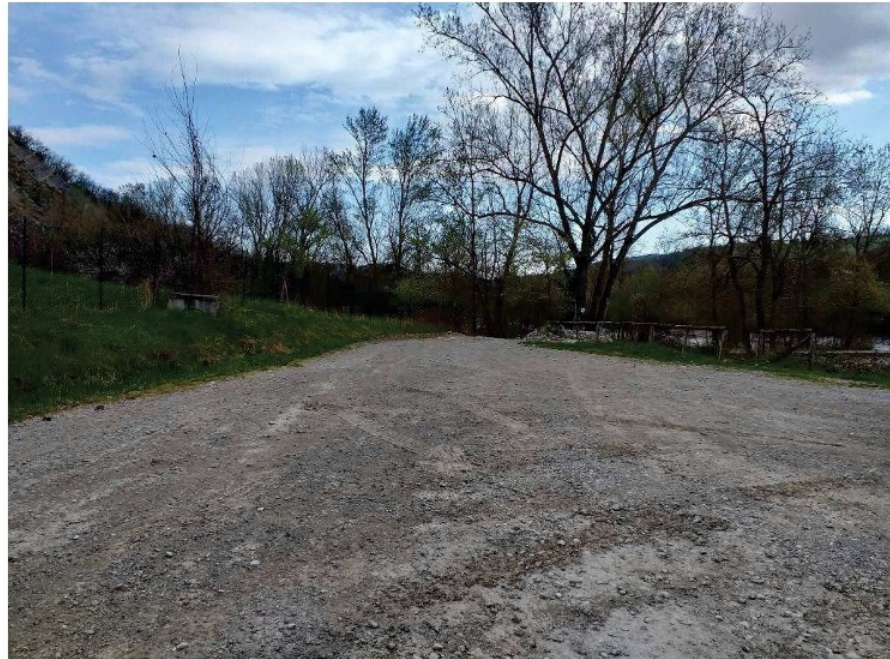
Immagine 3: strada di accesso allimpianto