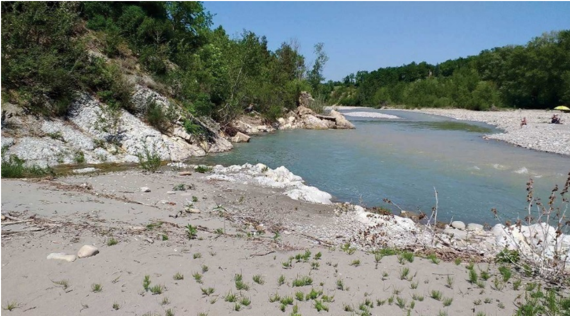
Immagine 2: punto di restituzione a valle