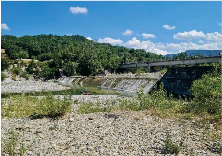
Immagine 1: Particolare della briglia vista da valle