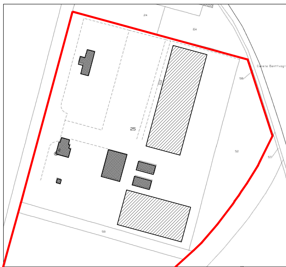
Estratto di Mappa - Scala 1:2000