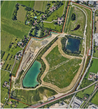
Località: Area "Ex Vela" Via del Trebbo, 14 - 40131 Bologna