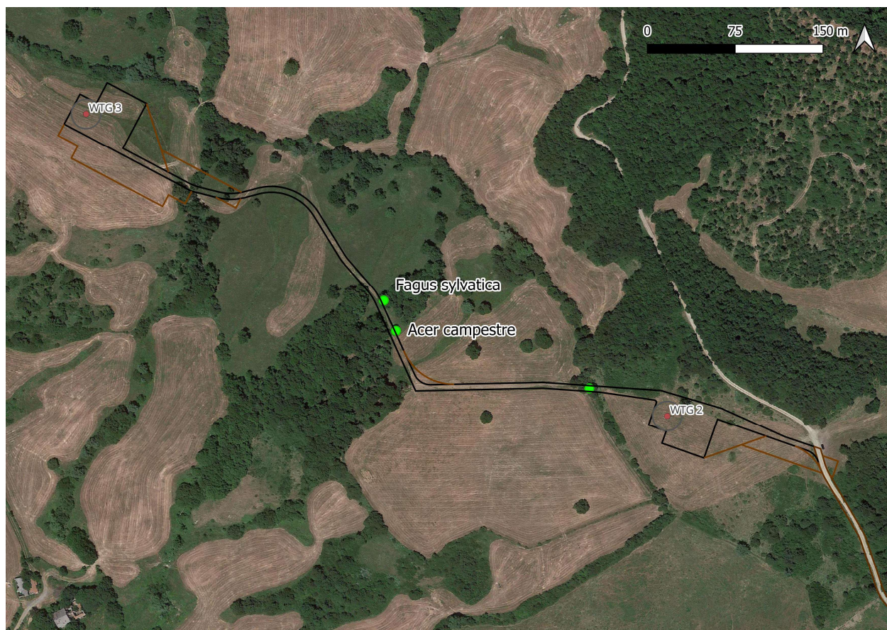
Figura 5.3 – Ubicazione Fagus sylvatica (diametro 100 cm) e Acer campestre (diametro 52 cm) – in nero le aree di occupazione permanenti.

Di seguito viene riportato un inquadramento generale dell'ubicazione di tutte le formazioni descritte in precedenza (Figura 5.4). Per maggiori dettagli circa la precisa ubicazione e la documentazione fotografica si rimanda a planimetria allegata al presente fascicolo (vedi Allegato da 1 a 5), mentre per i dettagli circa l'ubicazione catastale e i relativi proprietari si rimanda alle Schede di dettaglio (Allegato 6).