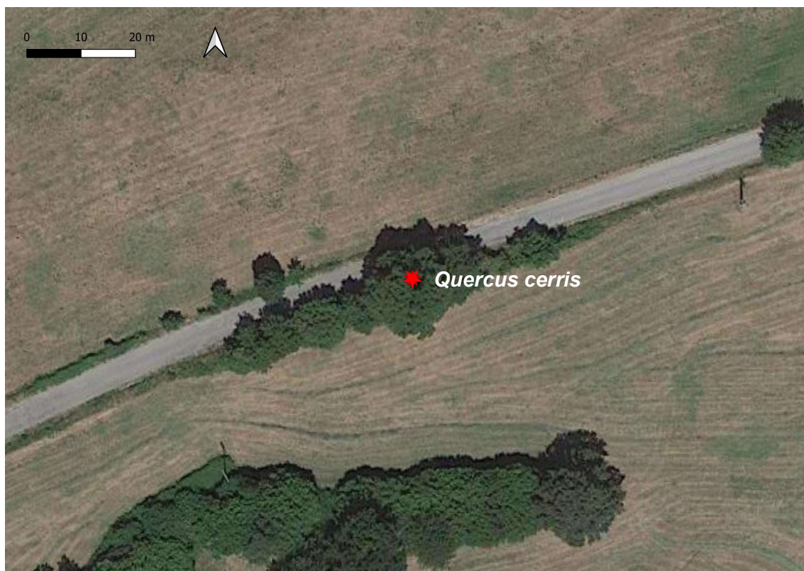
Figura 5.1 – Ubicazione di un cerro ( Quercus cerris ) di diametro pari a 100 cm

Di seguito si riporta un inquadramento generale dell'ubicazione delle essenze rilevate (Figura 5.2). Per maggiori dettagli circa la precisa ubicazione delle stesse e la relativa documentazione fotografica si rimanda alle planimetrie allegate al presente fascicolo (vedi Allegato da 1 a 5), mentre per i dettagli circa l'ubicazione catastale e i relativi proprietari si rimanda alle Schede di dettaglio (Allegato 6).