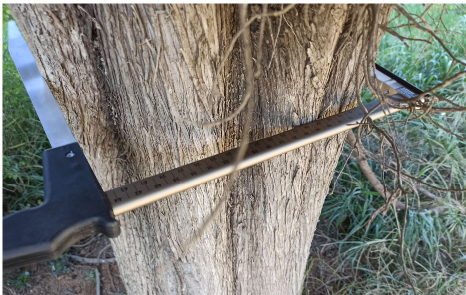
Figura 3.1 - Rilievo del diametro dei fusti tramite cavallettamento

La misurazione dei diametri dei tronchi è stata effettuata con apposita strumentazione (Figura 3.1) (cavalletto dendrometrico) a petto d'uomo (h. 1,30 m da terra) in linea con le metodologie consolidate del settore.