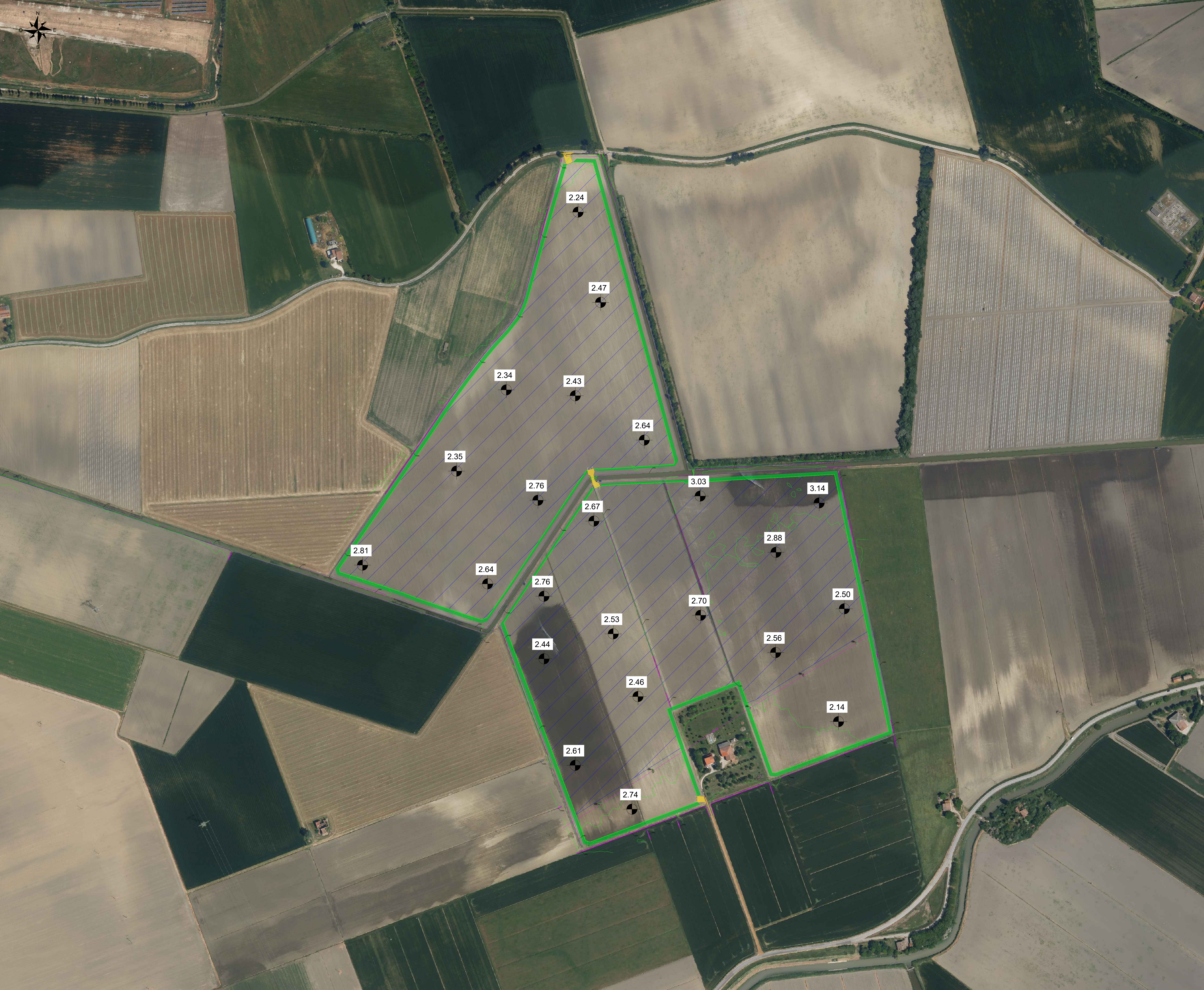
Inquadramento Vista A - Scala 1:2000