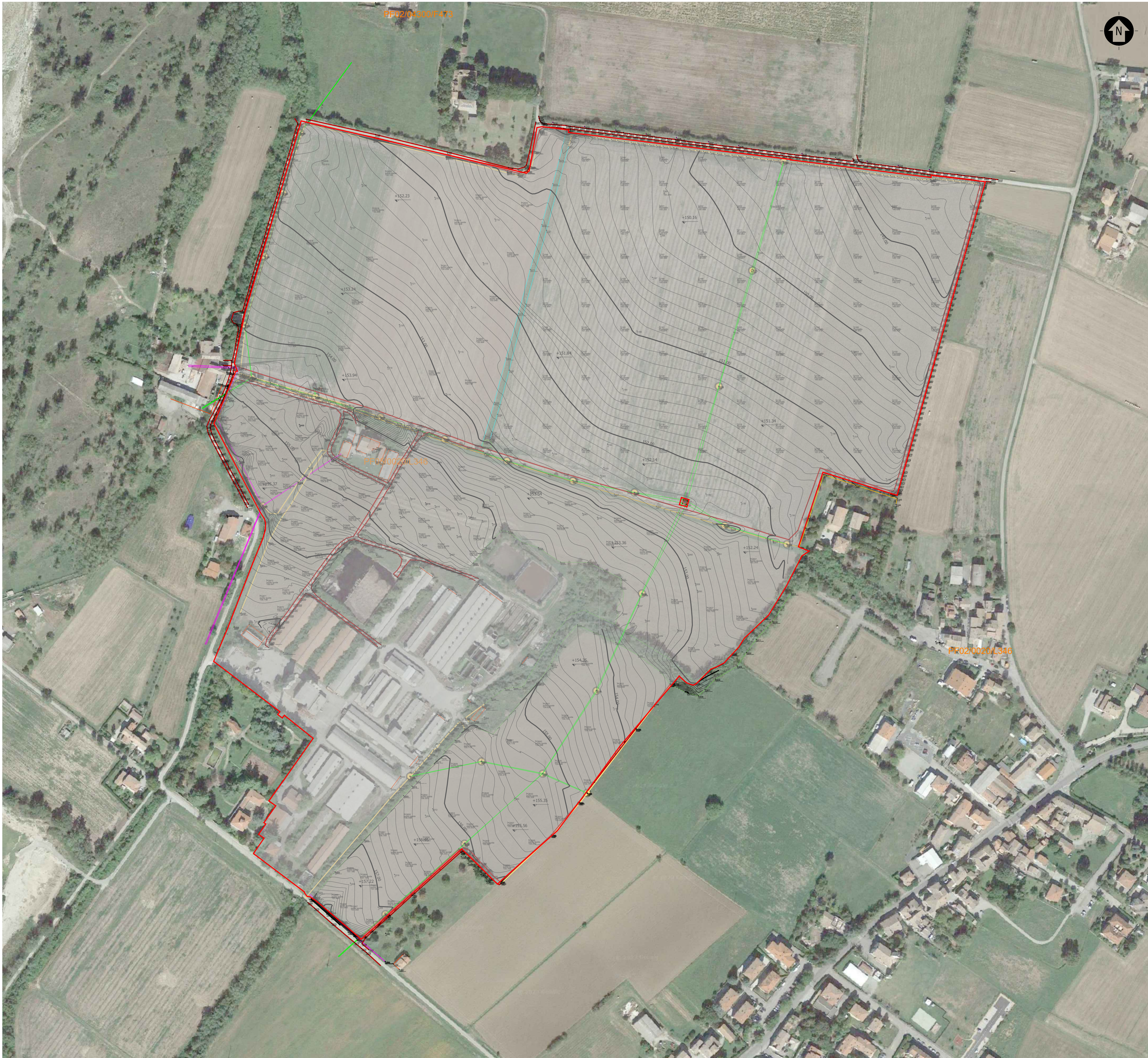
STATO DI FATTO, RILIEVO TOPOGRAFICO ORTOFOTOGRAFICO