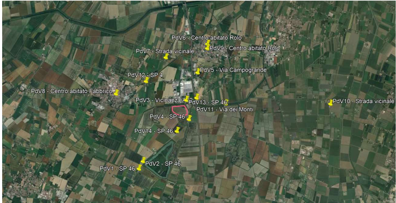
Figura 1 – Areofoto con indicazione dei punti di vista statici e dinamici

Di seguito si riportano le foto effettuate dai punti di vista individuati in figura sottostante, per le quali è stata effettuata un'analisi dell'ante e del post operam: