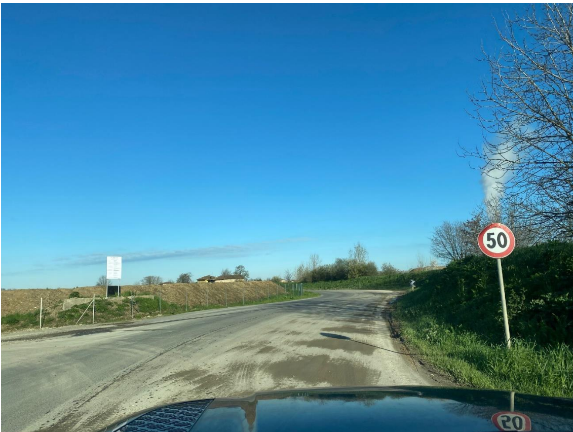
Foto 2 – Strada Via Macchioni uscita area impianti, direzioni Ovest