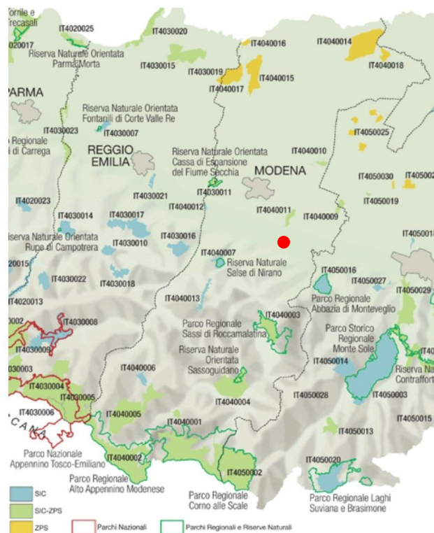
Estratto cartografia Siti Natura 2000 nella Provincia di Modena estrapolato dal portale Ambiente della Regione Emilia Romagna - Il bollino rosso individua l'area oggetto di studio