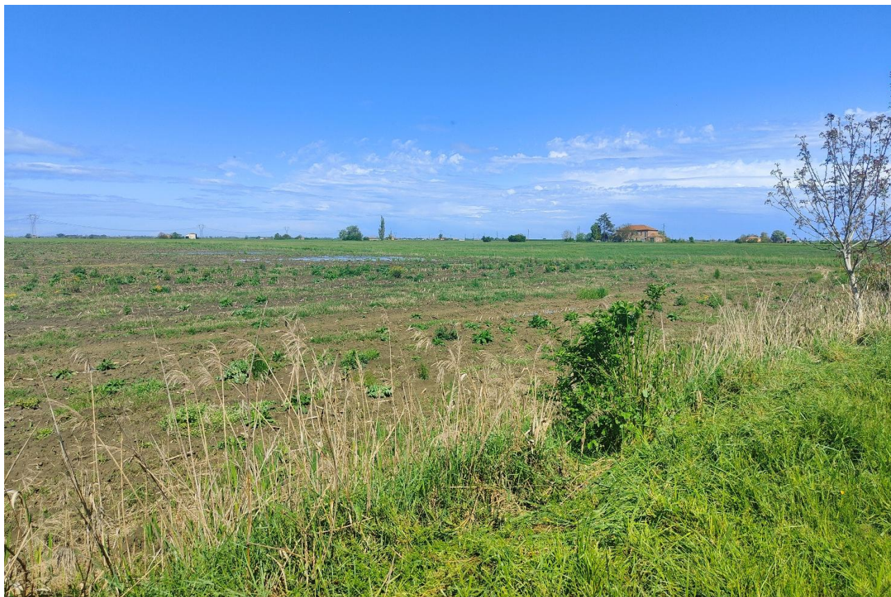
Punto di scatto 3: