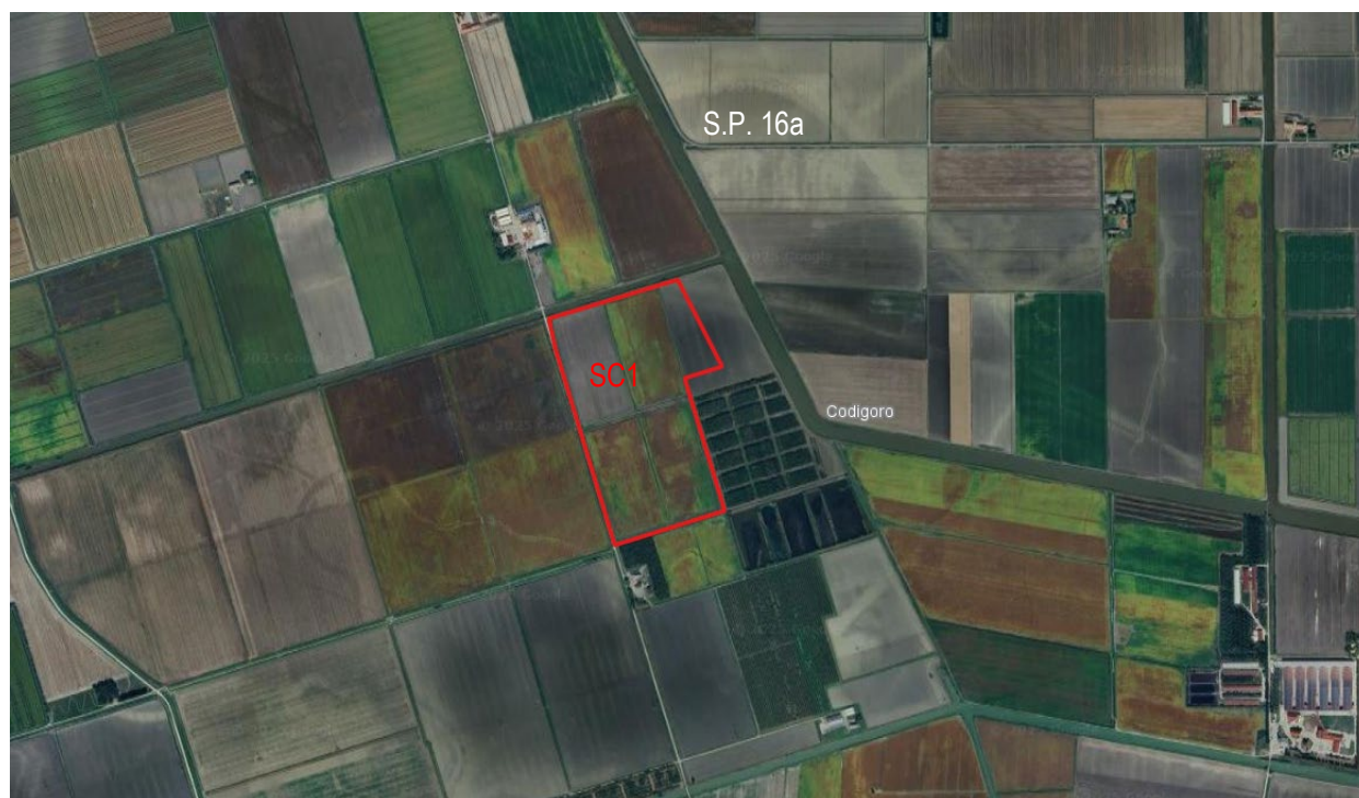
Figura 1.1: Inquadramento aree impianto FV su foto satellitare (scala 1:20.000)

Le aree di progetto sono caratterizzate da campi agricoli a seminativi. Non vi sono nuclei abitati nei dintorni tranne che qualche casa sparsa. I centri abitati più vicini sono Jolanda di Savoia e Fiscaglia. Il sito è a circa 5 km a nord-ovest dal centro del Comune di Codigoro. Le maggiori vie di comunicazione prossime alle aree di progetto sono: la SP 16a (Copparo Codigoro) che collega Codigoro con Jolanda di Savoia e la SR 495 (Localita per Ferrara). Nelle illustrazioni che seguono sono rappresentati gli inquadramenti foto-cartografici dell'area di intervento su varie basi di sovrapposizione e a varie scale di riproduzione con l'introduzione di elementi tematici significativi.