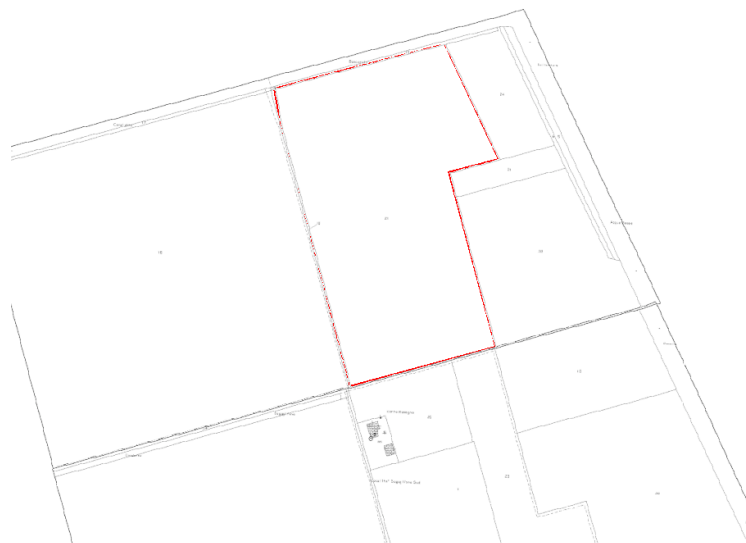
Figura 1.3: Inquadramento aree impianto FV su cartografia catastale (scala 1:2.000)