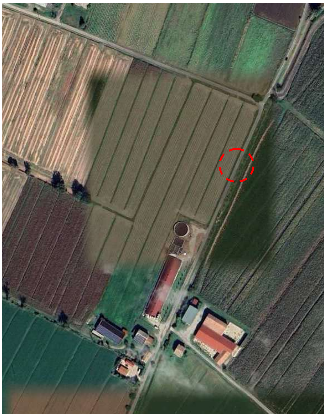
Ortofoto – area oggetto di intervento – nuovo passo carrabile