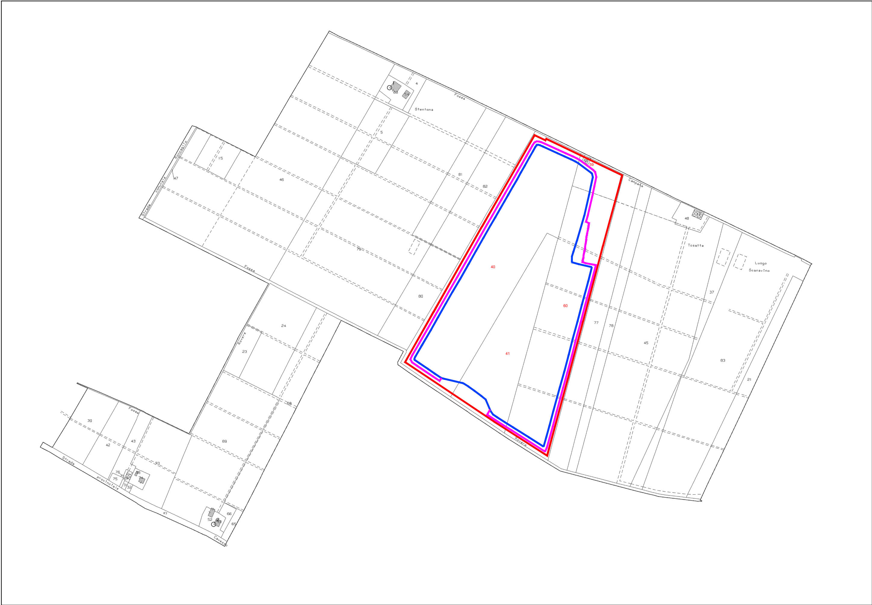
Mappa Catastale - Foglio n. 25 Scala 1:5.000