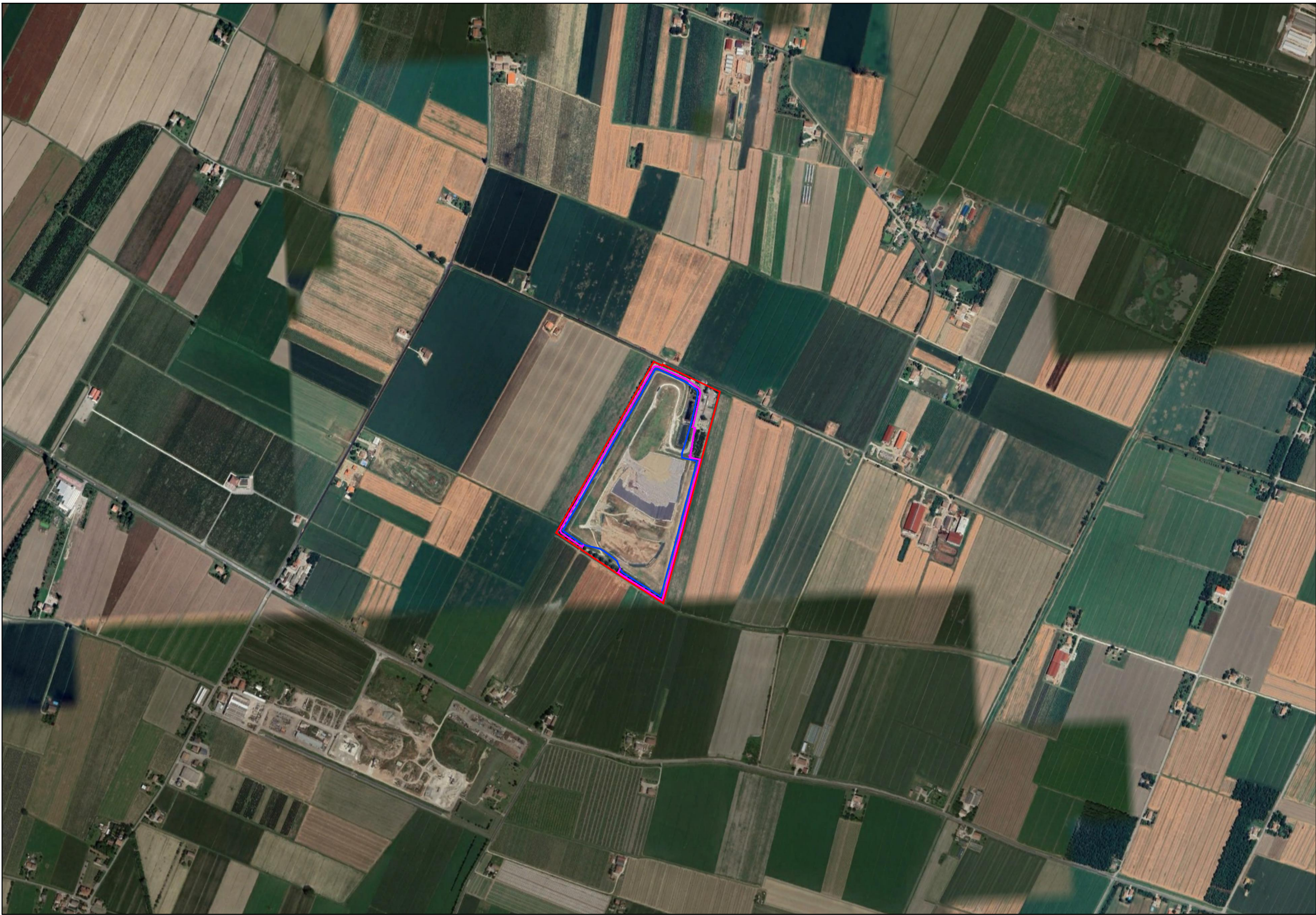
Ortofoto Scala 1:10.000