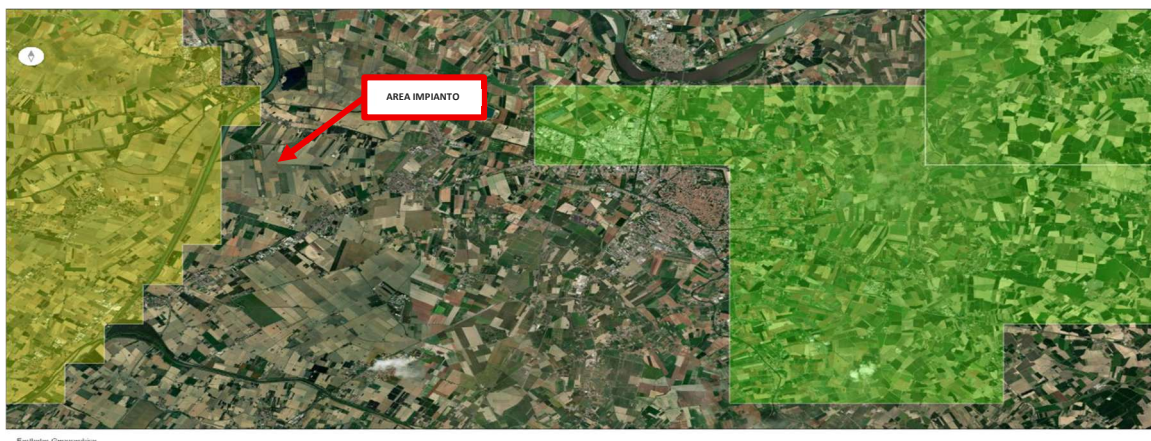
Figura 2 – WebGIS UNMIG - Ferrara