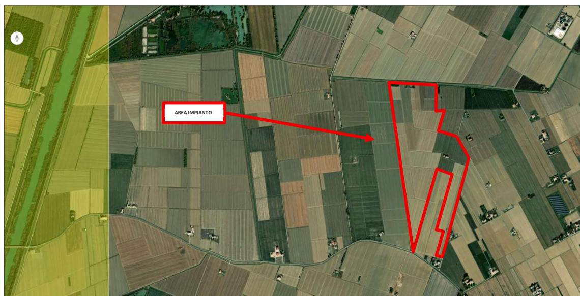
Figura 3 – WebGIS UNMIG – Area impianto