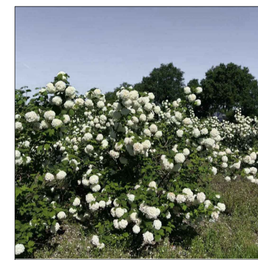
● Viburnum Opulus