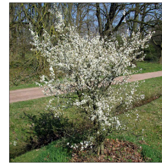
● Pronus spinosa