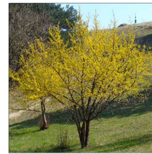
● Cornus Mas