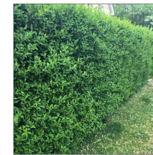
● Ligustrum vulgare Siepe perimetrale a ridosso della recinzione