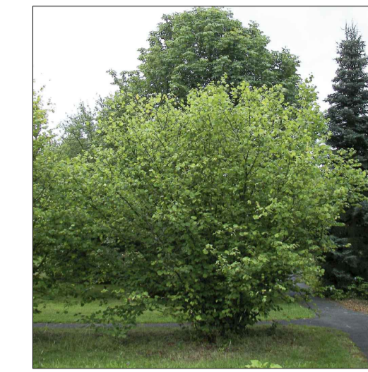
● Corylus Avellana