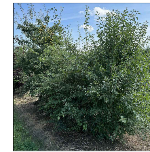
● Rhamnus Cathartica